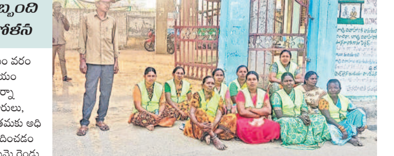
వర్ధనపేట మున్సిపల్ కార్యాలయం ఎదుట ధర్మా చేస్తున్న పారిశుధ్య కార్మికులు

వర్ధనపేట, మార్చి 23 : వేతనాల కోసం వరంగల్ జిల్లా వర్ధనపేట మున్సిపల్ కార్యాలయం ఎదుట పారిశుధ్య కార్మికులు శనివారం ధర్మా చేశారు. నిత్యం తెల్లవారుజామునే రహదారులు, అంతర్గత రోడ్లు, డ్రైనేజీలను శుభ్రం చేసే తమకు అధికారులు నాలుగు నెలలుగా వేతనాలు అందించడం లేదని ఆందోళన వ్యక్తం చేశారు. ఈ విషయంపై రెండు నెలల క్రితం మున్సిపల్ కార్యాలయం ముందు భైతాయింది నిరసన తెలిపారు. అయినప్పటికీ మున్సిపల్ అధికారులు పట్టించుకోకపోవడంతో నెలలుగా వేతనాలు అధికంగా తీవ్ర ఇబ్బందులకు గురవుతున్నామని పేర్కొన్నారు. వేతనాల విషయంలో అధికారులు నిర్లక్ష్యంగా వ్యవహరిస్తున్నా పాలక మండలి