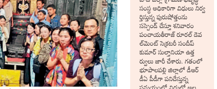
రామప్పలో పూజలు చేస్తున్న వియత్నాం దేశస్తులు