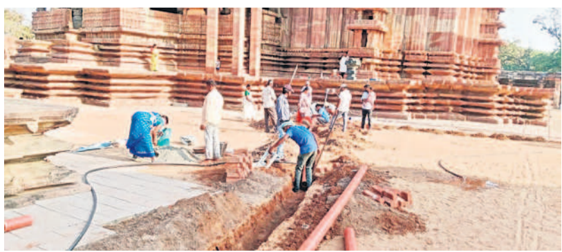
సోమనూత్రం పునరుద్ధరణలో భాగంగా వైపులు వేస్తున్న నిబ్బంది