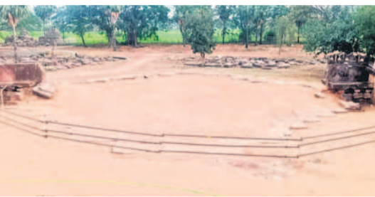
కామేశ్వరాలయం నిర్మాణం జరిగే ప్రదేశం

తనలో కామేశ్వరాలయం పనులు ప్రారంభం కామేశ్వరాలయంతో పాటు, ఆగ్నేయ దిశలో సగం వరకు కూలిన ప్రహారీ నిర్మాణానికి పురావస్తు శాఖ అధికారులు తీసుకుంటున్నారు. గతంలోనే కామేశ్వరాలయం పునరుద్ధరణకు కేంద్ర పురావస్తు శాఖ రూ.11కోట్లు మంజూరు చేయగా తనలోనే పనులు ప్రారంభించేందుకు సన్నాహాలు చేస్తున్నారు.