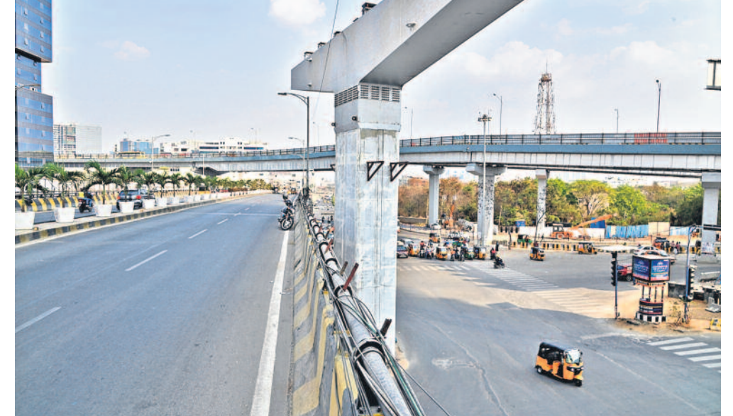
ఎండ తీవ్రతకు నిర్మాణస్థాయిగా మాలిన గట్టిబొలిలోని శిల్ప లేఅవుట్ ఎక్స్పోజ్

హైకోర్టు కోసం.. బయోడైవర్సిటీ బలి విద్యార్థుల నిరసన బేఖాతరు 'కోడ్'లోనూ ఆగని పనులు యంత్రాలతో చెట్ల కూల్చివేత ఉద్యమిస్తున్న విద్యార్థులకు పోలీసులు బెదిరింపులు నేడు పనుల అడ్డగింపు ప్రజాసంఘాల పిలుపు > 3