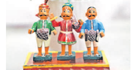
పోచంపల్లి - యాదాద్రి భువనగిరి జిల్లా నిర్మల్ - ఆదిరాజు జిల్లా చేర్యాల - సిద్దిపేట జిల్లా వెంబర్తి - జనగామ

తెలంగాణ రాష్ట్రం అద్భుతమైన చిత్ర లేఖన సంస్కృతులు, సంప్రదాయాలకు, ఆచారాలకు నిలయమైంది. హస్తకళా వస్తువులకు అత్యున్నత ప్రాధాన్యం కలిగి ఉంది. వీటిని అభివృద్ధి చేయడానికి కేంద్రప్రభుత్వం కొన్ని గ్రామీణ పర్యాటక ప్రాజెక్టులను గుర్తించింది.