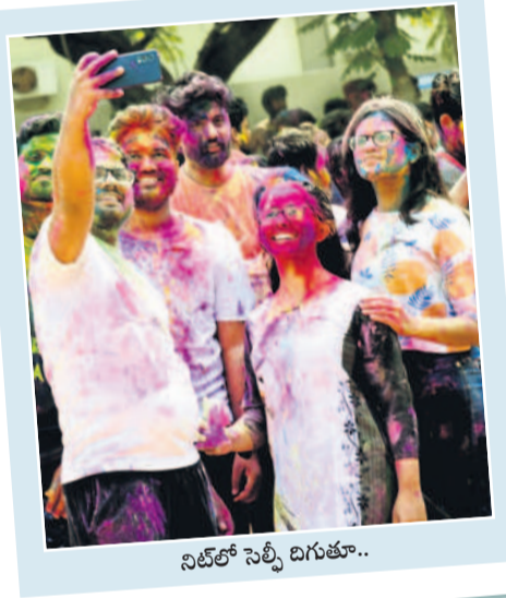
నిట్లో సెట్టి బిగుతూ..