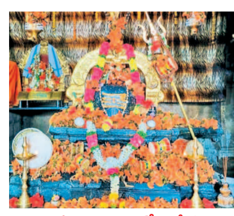
మోదుగుపాల అలంకరణలో గణపేశ్వరుడు

హనుమకొండ, మార్చి 25 : ఎర్రగట్టుగుట్ట వేంకటేశ్వరస్వామి జాతర బ్రహ్మోత్సవాలు సోమవారం ఆంగరంగ వైభవంగా ప్రారంభమయ్యాయి. హనుమకొండ, ధీమారంలోని వేంకటేశ్వరస్వామి ఆలయాల నుంచి రథాలపై శ్రీదేవి, భూదేవి సమేత స్వామివారి ప్రతిమలను డప్పువచ్చుతూ ఊరేగింపుగా ఎర్రగట్టు గుట్ట వేంకటేశ్వరస్వామి ఆలయానికి తీసుకొచ్చారు. రాత్రి 11.48 గంటలకు అర్చకులు వైభవంగా స్వామివారి కల్యాణం నిర్వహించారు. అనంతరం జాతర ప్రారంభమైంది. ఈ జాతరకు వివిధ రాష్ట్రాల నుంచి భక్తులు తరలివచ్చి వేంకటేశ్వరస్వామిని దర్శించుకొని మొక్కులు చెల్లించుకుంటారు. అలాగే, వివిధ గ్రామాల నుంచి భక్తులు రాత్రి ఎడ్లబండ్లతో వచ్చి గుడుడుతూ తిరిగి స్వామివారిని దర్శించుకున్నారు. ఈ వేడుకలు ఐదు రోజులపాటు జరుగుతున్నాయి.