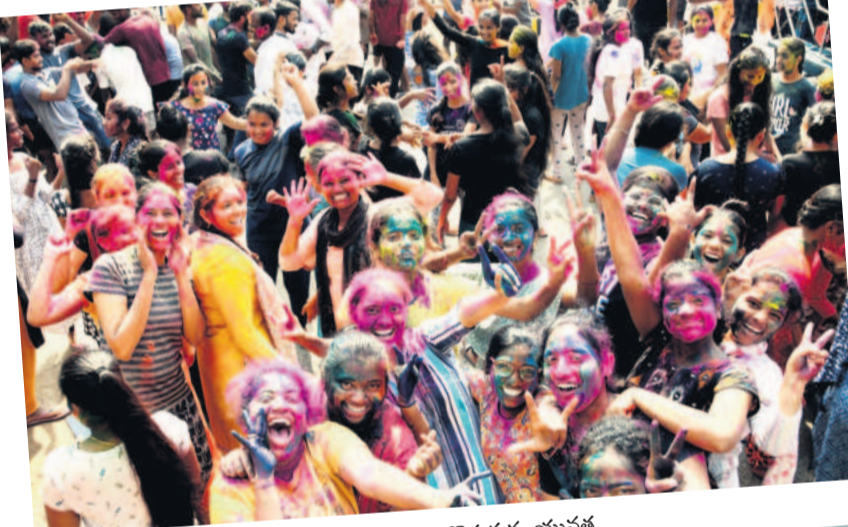
కాకతీయ యూనివర్సిటీలో కేలంతలు కొడుతున్న యువత