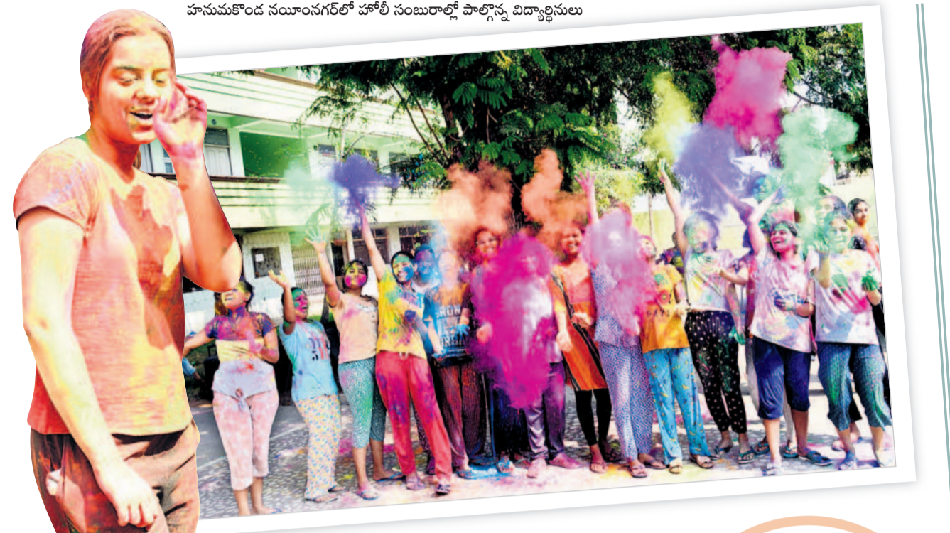
హనుమకొండ నయానగర్లో హోలీ సంబురాల్లో పాల్గొన్న విద్యార్థులు