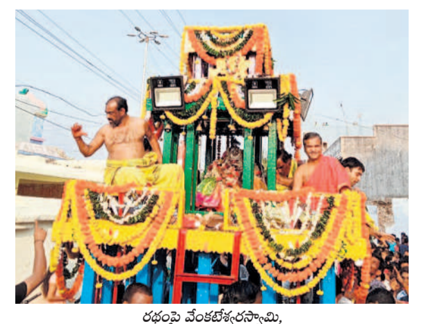
రథంపై వేంకటేశ్వరస్వామి, శ్రీదేవి, భూదేవి అమ్మవార్ల ప్రతిమలు తీసుకొస్తున్న అర్చకులు