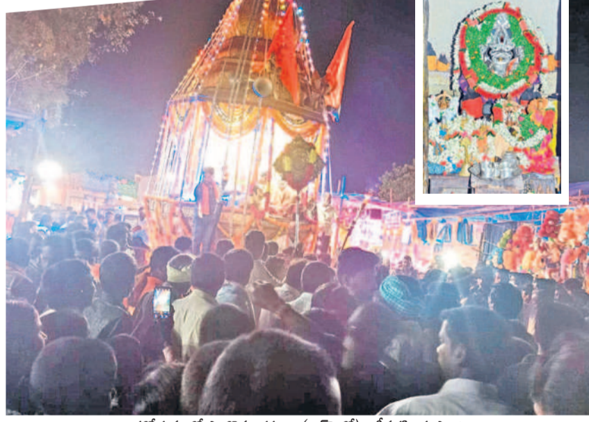
రథోత్సవంలో పాల్గొన్న భక్తులు, (ఇన్సీసీ) లక్ష్మీనరసింహస్వామి