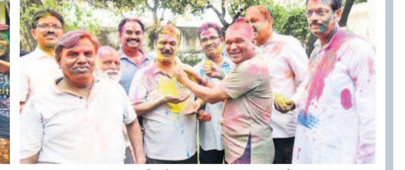
కలీనగర్ ఆర్టివో మహేశ్వర్ కు రంగులు పూస్తున్న ఉద్యోగులు