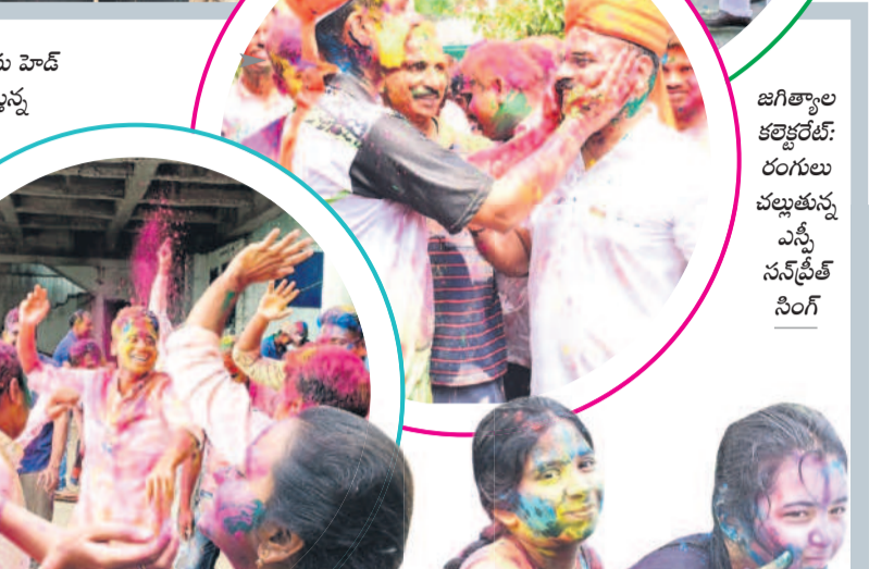
జగిత్యాల కలెక్టర్: రంగులు చల్లుతున్న ఎస్సీ సనత్ సంగ్