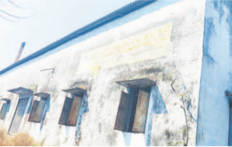
మాచితి రైన్ మిల్

పెద్దపల్లి, మార్చి 25 (నమస్తే తెలంగాణ): రైతుకు మద్దతు ధర ఇస్తూ ప్రభుత్వరంగ సంస్థల ద్వారా ప్రభుత్వం ధాన్యం కొంటున్నది. సదరు ధాన్యాన్ని పైసా పెట్టుబడి లేకుండా కస్టం మిల్లర్ రైన్ (సీఎంఆర్) పేరిట మిల్లర్లకు అందిస్తున్నది. రా రైన్ మిల్లర్లు అయితే అయితే ధాన్యానికి 67 కోట్లు, అదే బాండు మిల్లర్లయితే 68 కోట్ల బియ్యం ఇవ్వాలి అంటుంది. సీఎంఆర్ తీసుకున్నాక మూడు నెలల్లో బియ్యంగా మార్చి ఎప్పటికీ అప్పగించాలి. యాసంగిలో పచ్చిన ధాన్యాన్ని వాసకాలం వరకు, వాసకాలంలో వచ్చిన ధాన్యాన్ని యాసంగి వరకు బియ్యంగా మార్చి ఇవ్వాలి. కానీ, తిరిగి బియ్యం ఇవ్వడంలో చాలా వరకు మిల్లర్ల మాయాజాలం కనిపిస్తున్నది. 2022-23 యాసంగికి సంబంధించి పెద్దపల్లి జిల్లాలో 43 శాతం మాత్రమే సీఎంఆర్ పూర్తి కాగా, 2023-24 వాసకాలంలో అయితే, కేవలం 2 శాతం మాత్రం కావడం అనేక అనుమానాలకు తావిస్తున్నది. పదే పదే గడువు పొడిగిస్తున్నా.. బియ్యం ఇవ్వడంలో నిర్లక్ష్యం కనిపిస్తున్నది. చర్యలు లేకపోవడంలో కొంతమంది అక్రమాలకు తెరచి, ప్రభుత్వం ఇచ్చిన పక్షం ఎవరు వెళ్లి రాకొక్కట్లు ప్రభుత్వంపై తెలుస్తున్నది. బియ్యం కంటే ధాన్యం అమ్మితే ఎక్కువ అక్రమార్కం వస్తుంది భావించి ఇతర జిల్లాల, రాష్ట్రాలకు అక్రమంగా ధాన్యాన్ని తరలింపి విక్రయించినట్లు తెలుస్తున్నది. ఇప్పటికే చలువ చోట్ల రాకొక్కట్లు విలువైన ధాన్యాన్ని అమ్ముతున్నట్లు అధికారుల తనిఖీలో బహిష్కరణపడింది.