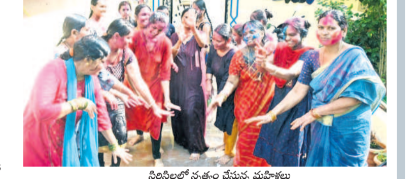
సిలిసిల్లో సత్కారం చేస్తున్న మహిళలు