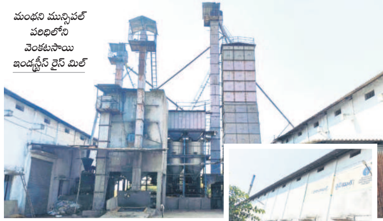
మంధని మున్సిపల్ పరిషత్లోని వెంకటసాయి ఇండస్ట్రీస్ రైన్ మిల్