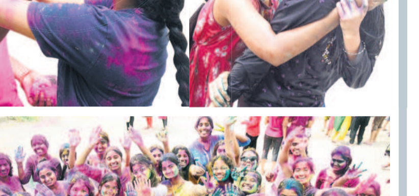
కలీనగర్: వేడుకల్లో యువతుల సత్కారం