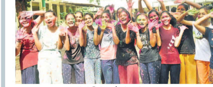
కలీనగర్: సత్కారం చేస్తున్న యువతులు