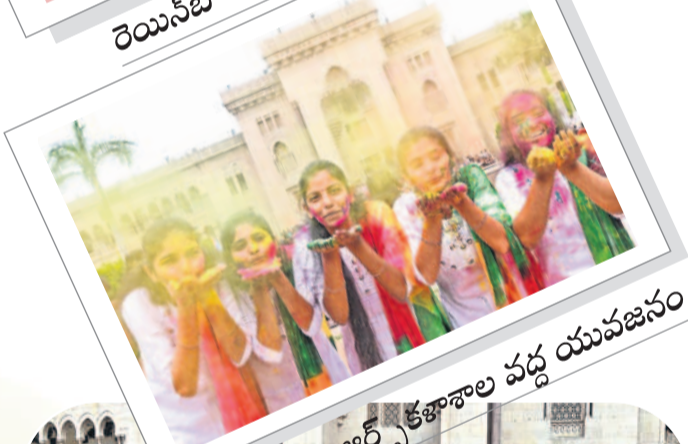
ఆర్ట్స్ కళాశాల వద్ద యువజనం