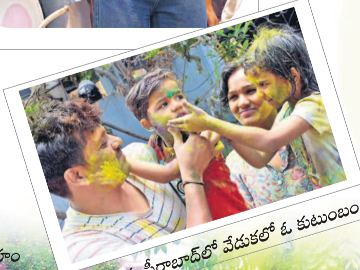
ముషీరాబాద్ లో వేడుకలో ఓ కుటుంబం