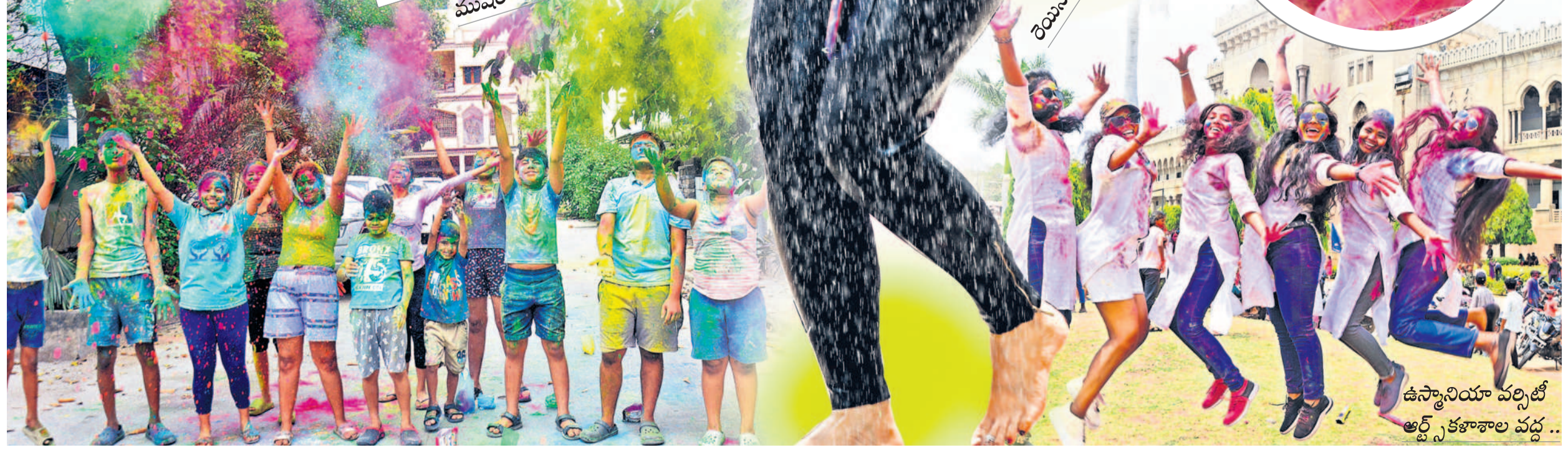
ఉస్మానియా వల్లిట్ ఆర్ట్స్ కళాశాల వద్ద..