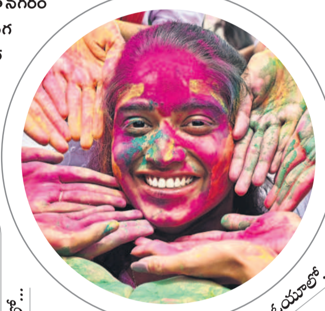
నక్సల్ రోడ్డులోని పీపుల్స్ ప్లాజా వద్ద..