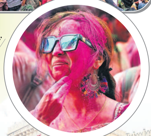
రెయిన్ బో విస్టాస్ లో యువత్తి స్వర్ణం..