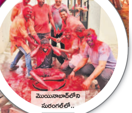
మొయినాబాద్ లోని సరంగల్ లో..