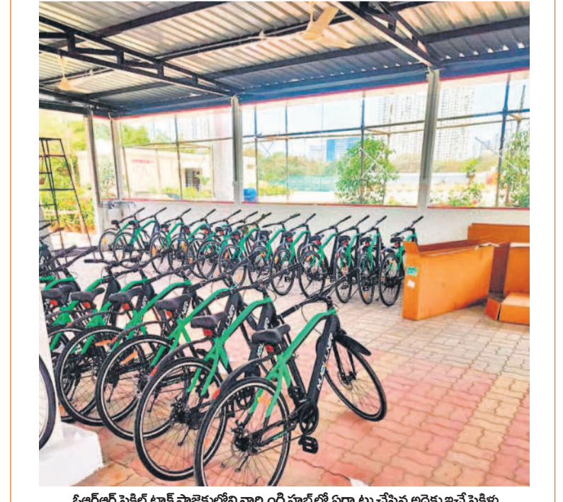
బీఆర్ఎస్ సైకిల్ ట్రాక్ ప్రాజెక్టులోని నార్సింగి హాట్ లో ఏర్పాటు చేసిన అద్దెకు ఇచ్చే సైకిళ్లు

చేసి సుమారు 200 సైకిళ్లను అందుబాటులో ఉంచగా, అందులో 40కి పైగా ఎలక్ట్రిక్ సైకిళ్లు ఉన్నాయి. నగరంలో సైకిలింగ్ గంటకు రూ.50 చేయడం వల్ల ప్రభుత్వం ప్రోత్సహించే ప్రయోజనం వల్ల ప్రజలకు అనుకూలంగా ఉంటుంది. ప్రస్తుతం మొదటి సైకిల్ స్టేషన్ ను నార్సింగి హాట్ లో ఏర్పాటు చేసి సుమారు 200 సైకిళ్లను అందుబాటులో ఉంచగా, అందులో 40కి పైగా ఎలక్ట్రిక్ సైకిళ్లు ఉన్నాయి. నగరంలో సైకిలింగ్ గంటకు రూ.50 చేయడం వల్ల ప్రభుత్వం ప్రోత్సహించే ప్రయోజనం వల్ల ప్రజలకు అనుకూలంగా ఉంటుంది.