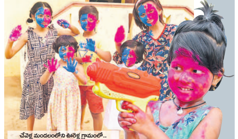
చేపల్లె మండలంలోని ఊరేగణం గ్రామంలో..