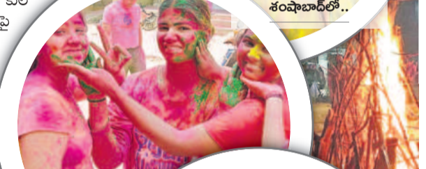
మొయినాబాద్ లోని సరంగల్ లో..