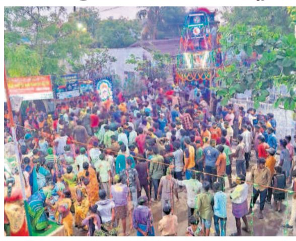
పిల్లలమర్రిలో వైష్ణవోత్సవానికి రథోత్సవంలో పాల్గొన్న భక్తులు

సూర్యాపేట రూరల్, మార్చి 25 : మున్సిపల్ పరిషత్లోని పిల్లలమర్రి గ్రామంలో వైష్ణవోత్సవం సామి 120వ వార్షిక బ్రహ్మోత్సవాల్లో భాగంగా సోమవారం తెల్లవారుజామున రథోత్సవ వాన్ని ఘనంగా నిర్వహించారు. దేవాలయం నుంచి గ్రామ పురవీధుల్లో