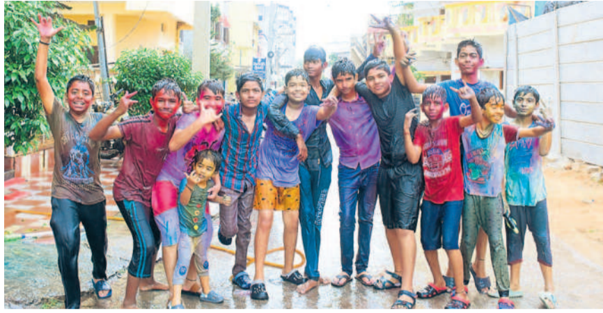
భువనగిరిలో హోల్ ఆడుతున్న చిన్నారులు