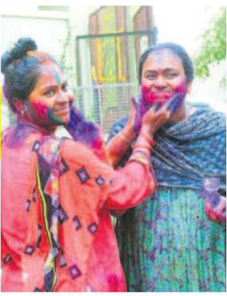
భువనగిరిలో రంగులు చల్లుకుంటున్న మహిళలు

వసంత రుతువులో వచ్చే తొలి పండుగ హోలీ పండుగను జిల్లా వ్యాప్తంగా ఘనంగా జరుపుకొన్నారు. వాడవాడలా చిన్నా, పెద్ద రంగులు పులుముకొని సంతోషంగా గడిపారు. దప్పణ్ణి, డీజే పాటలతో డ్యాన్స్ చేశారు. కేరంతులు కొడుతులు క్యాబిలు తీశారు. చిన్నారులు ఎక్కడ చూసినా బాబీ గ్లలో రంగులు నింపుకొని సరంజీలు వట్టుకొని కనిపించారు. కాంటిలు, అపార్ట్ మెంట్లలో సామూహిక వేడుకలతో పండుగ వాతావరణం నెలకొన్నది. వలుచోట్ల హోలీ వేడుకల్లో ప్రజాప్రతినిధులు, అధికారులు పాల్గొని అందరిలో ఉత్సాహం నింపారు.