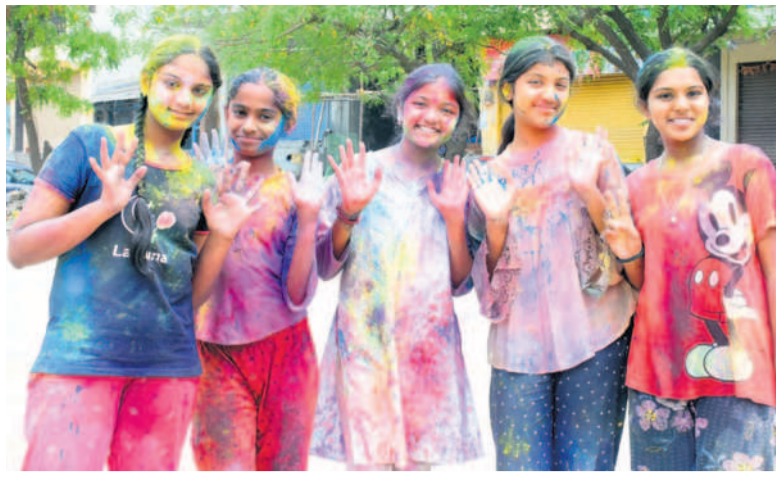
భువనగిరి గంజీల్ హోల్ ఆడుతున్న యువతులు