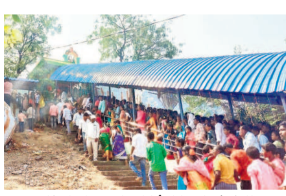
లింగమంతుల స్వామిని దర్శించుకునేందుకు బారులుదీరిన భక్తులు

రథంపై స్వామి వారి ఉత్సవ విగ్రహాలను ఊరేగించారు. అనంతరం హోలీ వేడుకలను జరుపుకొన్నారు. డీజే పాటలకు మహిళలు, యువత రంగులు చల్లుకుంటూ, నృత్యాలను చేస్తూ ఉత్సాహంగా గడిపారు.