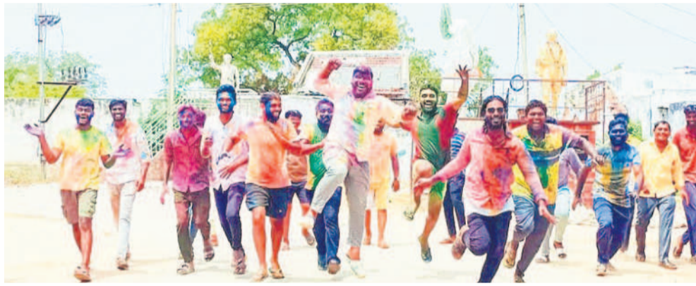
నంస్థాన్ నారాయణపురంలో హోలీ ఆడుతున్న యువకులు