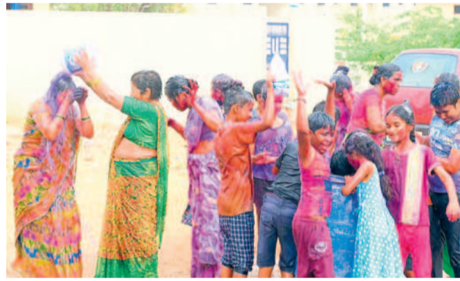
భూదాన్ పోలవరపల్లిలో హోలీ ఆడుతున్న మహిళలు, చిన్నారులు