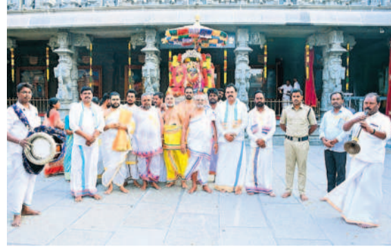
యాదగిరిగుట్ట హోలీకోత్సవం నిర్వహిస్తున్న అర్చకులు

యాదగిరిగుట్ట, మార్చి 25 : యాదగిరి గుట్ట లక్ష్మీ నరసింహ స్వామి ఆలయంలో సోమవారం వసంతోత్సవ వాన్ని వైభవంగా నిర్వహించారు. ప్రధాన యువ మొదటి ప్రాకార మండపంలో స్వామి, అమ్మవార్ల ఉత్సవమార్పలను ప్రత్యేకంగా ఆలంకరించారు. చిలుకల పేర్లు వేసి ఉత్సవ వాన్ని ప్రారంభించారు.