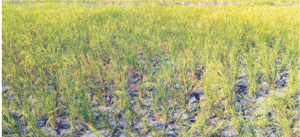
అనుముల మండలం చల్లారెడ్డిగూడెంలో నీళ్ల లేక ఎండిపోయిన వరిచేలు

కుంటూ వచ్చారు. గత నెల వరకు వరిచేలు బాగానే ఉన్నాయి. పంట పాట్లు దశలో ఉండగా భూగర్భ జలాలు అడుగుంటడంతో కాల్యకు వారం రోజులపాటు మొదటి జోన్ లోని రైతులకు సాగునీరు ఇస్తే పంటలు చేతికి వచ్చే అవకాశం ఉన్నది. మరోవైపు చెరువులు, కుంటలు నిండి ఎండాకాలంలో పశుపక్ష్యాదులకు నీటికి ఇబ్బంది లేకుండా కానీ ప్రభుత్వం నుంచి సృందన లేదు. దాంతో నియోజకవర్గంలో ఇప్పటికే 25 వేల ఎకరాల్లో వరిపంటలు పూర్తిగా ఎండిపోయాయి. అనుముల మండలంలోని 15 గ్రామాల్లో పంటలు చేతి కందకుండా పోయాయి. పులిగూమిడి, రామడుగు, అనుముల, మదారినూడెం, హజారి గూడెం, చల్లారెడ్డిగూడెం, పుల్లారెడ్డిగూడెం, కొట్లాల సూరవల్లి గ్రామాల రైతులు కన్నీరు మున్నీరవుతున్నారు. ఎండిన వరి చేలు వేసే దేమీ లేక రైతులు పశువులను మేపుతున్నారు.