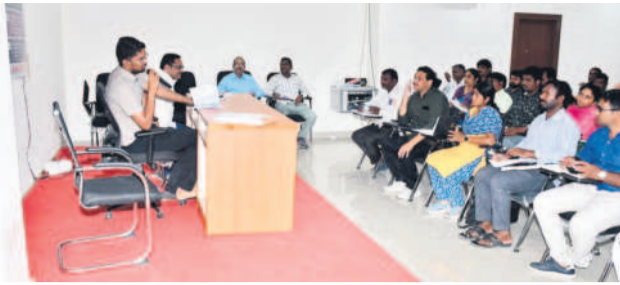
మాట్లాడుతున్న కమిషనర్ ఆదర్శ సురభి

ఖమ్మం, మార్చి 26 : ఖమ్మం కార్పొరేషన్లో ఇంటిపన్ను వడ్డీపై రాయితీ చెల్లించడానికి మరో ఐదురోజుల గడువు మాత్రమే ఉన్నందున ప్రత్యేక అధికారులు, బిల్ కలెక్టర్లు చొరవ చూపి వందశాతం పన్నులు వసూలుకు కృషి చేయాలని ఖమ్మం మున్సిపల్ కమిషనర్ ఆదర్శ సురభి అన్నారు. మంగళవారం కార్పొరేషన్ కార్యాలయంలోని తన చాంబర్ లో ఏర్పాటు చేసిన సమీక్షా సమావేశంలో మాట్లాడుతూ పన్నులు చెల్లించని వారి జాబితా సిద్ధంగా ఉందని, వారిపై దృష్టిపారించి లక్ష్యాన్ని సాధించాలన్నారు. రాయితీ పలన వారికి కలిగి ప్రయోజనాలను వారికి వివరించాలన్నారు. బిల్ కలెక్టర్లు ప్రత్యేకా ఉదయం 7 గంటలకే విధుల్లో ఉండాలని ఆదేశించారు. వివిధ వృత్తుల్లో ఉన్నవారు సాయంత్రం ఇంటికి చేరుకొనే సమయానికి బిల్ కలెక్టర్లు వైపు పన్నులు వసూలు చేయాలన్నారు. సమావేశంలో అసిస్టెంట్ కమిషనర్, స్పెషల్ ఆఫీసర్లు పాల్గొన్నారు.