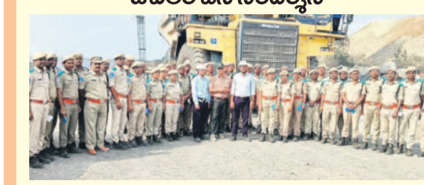
జేబీఆర్ ఓసీలో శిక్షణ బీట్ ఆఫీసర్లు