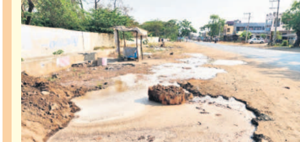
రోడ్డు పక్కన వారుతున్న వివిధ భగద్ర సీరు

వైరా టౌన్, మార్చి 26 : వైరాలోని స్థానిక మధిర రోడ్డులో మిషన్ భగద్ర ఫైల్ లైన్ పగిలి తాగునీరు వృధాగా పోతోంది. స్థానికులు తెలిపిన వివరాల ప్రకారం.. వైరా రిజర్వాయర్ నుంచి వస్తున్న నీటి ఫైల్ లైన్ పగిలిపోవడంతో గత రాత్రి నుంచి తాగునీరు వృధాగా పోతూ మధిర రోడ్డులో చిన్నపాటి చెరువు తలపెస్తున్నది. తక్షణమే అధికారులు స్పందించి పటిష్ట చర్యలు తీసుకోవాలని స్థానికులు కోరుతున్నారు.