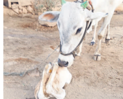
వెనుక వీపుపై కాళ్లు ఉన్న లేగదూడ