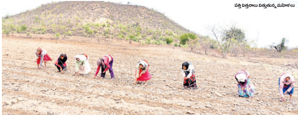
పత్తి విత్తనాలు విత్తనున్న మహిళలు