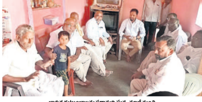
బాధిత కుటుంబాలను పరామర్శిస్తున్న మోక్షి మంత్రి

నిర్వహించేందుకు చర్యలు తీసుకుంటున్నట్లు వివరించారు. ఏర్పాట్లు చేశామని, సిబ్బందికి శిక్షణ ఇస్తామని తెలిపారు. ఏటా విడుదల చేసేవి నీటి ఎద్దడి నివారణకు చర్యలు తీసుకోవాలని సీఎన్ సూచించారు. గ్రామాల్లో మిషన్ భగీరథ ద్వారా ప్రతి అవసానికీ నీళ్లు సరఫరా చేయాలని ఆదేశించారు. వరి ధాన్యం కొనుగోలు కేంద్రాలను ప్రారంభించి వేస్తామన్నారు. ఈ వీసీలో అదనపు కల్తెకర్లు కిక్కిరకు మార్, వైజాన్ అభివృద్ధి పోల్చారు.