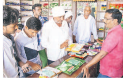
పత్తి విత్తనాలను కొనుగోలు చేస్తున్న రైతులు (ఫైల్)

అదిలాబాద్, మార్చి 26 (నమస్తే తెలంగాణ) : అదిలాబాద్ జిల్లావ్యాప్తంగా పత్తి అధికంగా సాగవుతున్నది. గతేడాది 8.85 లక్షల ఎకరాల్లో సాగింది. పెరిగిన ఎరువులు, పురుగు మందుల ధరల కారణంగా పెట్టుబడి పెరిగింది. కేంద్ర ప్రభుత్వం పత్తి విత్తనాల ధరను పెంచుతూ కేంద్ర ప్రభుత్వం నిర్ణయం తీసుకున్నది. దీంతో అన్నదాతలకు సాగు భారం కానున్నది. 450 గ్రాముల