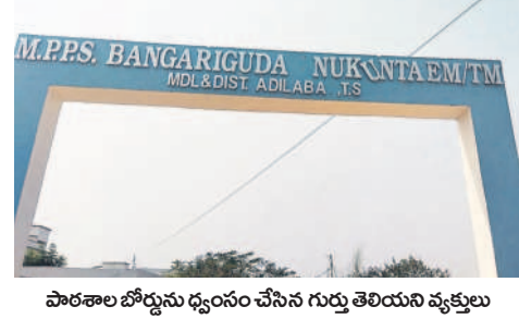
పాఠశాల బోర్డును ధ్వంసం చేసిన గుర్తు తెలియని వ్యక్తులు

అదిలాబాద్ రూరల్, మార్చి 26 : అదిలాబాద్ మండలంలోని బంగారుగూడ మండల పరిషత్ ప్రాథమిక పాఠశాలలో గుర్తు తెలియని వ్యక్తులు సామగ్రిని ధ్వంసం చేశారు. సోమవారం రాత్రి పాఠశాల ఆవరణలోని ఇనుపు పైపులతోపాటు కూర్చోనే గడ్డను పగుల గొట్టారు. ఈ విషయంపై ప్రధానోపాధ్యాయుడు ఆరోగ్య మాట్లాడుతూ.. గతంలో కూడా సామగ్రిని గుర్తు తెలియని వ్యక్తులు ధ్వంసం చేశారని, పోలీసులకు ఫిర్యాదు చేసినట్లు వెల్లడించారు. అయినప్పటికీ పాఠశాల ఆస్తిని పాడు చేస్తున్నారని వాపోయారు. అధికారులు స్పందించి రాత్రి వెళ్లిన పాఠశాలకు వాచ్ మన్స్ నియమించాలని కోరారు.