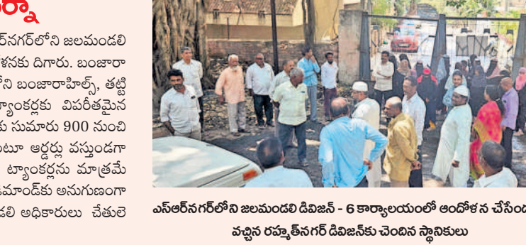
ఎన్ఆర్ఎస్ గోల్డ్ గోల్డ్ ని జలమండలి డిజిజి-6 కార్యాలయంలో ఆందోళన చేసినందుకు వచ్చిన రమ్మతనగర్ డిజిజి-6 నివాసులు

ఎల్లీనగర్లో ఎండిపోయిన బోరుబావులు ఎల్లీనగర్ నియోజకవర్గంలోని పలు కాలనీలు జలమండలి సరఫరా చేసే నీటిపైనే ఆధారపడుతున్నాయి. వేసవికాలం కావడంతో మంచినీటి కోసం డిమాండ్ పెరుగుతున్నది. భూగర్భ జలాలు అడుగుంటుండడంతో ఇండ్లలోని బోరుబావులు పూర్తిగా ఎండిపోయాయి. దీంతో ప్రజలు ట్యాంకర్లను ఆశ్రయిస్తున్నారు. ప్రతిరోజూ సుమారు 120 నుంచి 150 ట్యాంకర్ల వరకు సరఫరా చేస్తున్నారు.