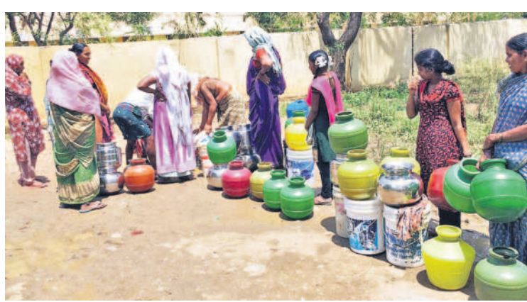
బుకింగ్ పరిస్థితి నియోజకవర్గంలో తాగునీటి కోసం బందెలతో క్యూలో నిలబడిన మహిళలు (ఫైల్)

సీటీబియూలో, మార్చి 27 (నమస్తే తెలంగాణ) : పదేండ్ల తర్వాత గ్రేటర్ వాసులు గుక్కడు నీటికోసం అల్లాడిపోతున్నారు. కేసీఆర్ హయాంలో.. పదేండ్ల కాలంలో ఏ రోజూ రాని నీటి సమస్య.. కాంగ్రెస్ ప్రభుత్వం పక్కలు చేపట్టిన మూడు నెలల్లోనే కరువు కోరలు చాస్తున్నది. మళ్లీ ఖాళీ బిందెలు చేతపట్టి రోడ్డు ఎక్కాల్సిన పరిస్థితి వచ్చింది. కండ్లముందు నీటి కచ్చాలు కనిపిస్తున్నా జలమండలి అధికారులు ప్రత్యామ్నాయ చర్యలు తీసుకోకపోవడంపై ప్రజలు ఆగ్రహం వ్యక్తం చేస్తున్నారు. వారానికోసం మారు అరకొరగా నీటి సరఫరా జరుగుతుండగా, ట్యాంకర్ల ద్వారా సైతం సరఫరా కాకపోవడంతో కాలనీల ప్రజలు తీవ్ర అవస్థలు పడుతున్నారు. మార్చి నెలలోనే పరిస్థితి ఇలా ఉంటే ఏ ఏప్రిల్, మే నెలల్లో ఎలా ఉంటుందోనని తలుచుకుంటేనే భయం వేస్తున్న రూప మహిళలు వాపోతున్నారు. పదేండ్లుగా మూలన పడేసిన క్రమమూలను మళ్లీ తీర్చాల్సి వచ్చిందని తెలుపుతున్నారు.