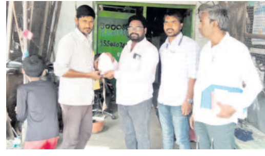
పెద్దకొడవగల్లో పన్ను వసూలు చేస్తున్న పంచాయతీ కార్యదర్శులు