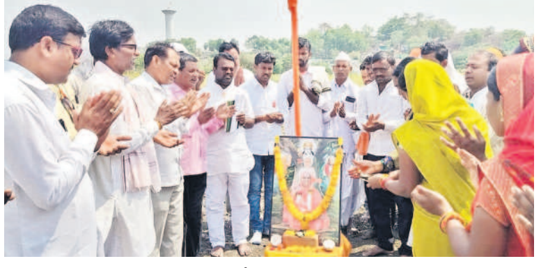
పూజల్లో పాల్గొన్న భక్తులు