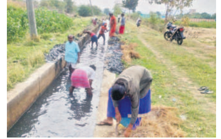
సోమేశ్వర్ లోని నిజాంసాగర్ డిస్ట్రిబ్యూటర్ కాలువలో పిల్లమొక్కలు, చెత్తను తొలగిస్తున్న కూలీలు

బాన్సువాడ రూరల్, మార్చి 27 : మండలంలోని ఉపాధి హామీ పనులు జోరండుకున్నాయి. బుధవారం మండలంలోని వివిధ గ్రామాల్లో కొనసాగుతున్న ఉపాధి హామీ పనులలో 1,750 మంది కూలీలు పాల్గొన్నారు. బోర్లం, హన్మంజీపేట్, సోమేశ్వర్, కోనాపూర్ గ్రామాల్లో పనులు చేస్తున్న కూలీల సంఖ్య భారీగా పెరిగింది. కూలీలు కాలువ పూడిక తీసి, కందకాల తవ్వకం పనులు చేస్తున్నట్లు ఎంపీవో మల్లేశ్ తెలిపారు. కొలతల ప్రకారం పనులు చేయిస్తున్నామని అన్నారు. మార్చి నెల ముగింపు నాటికి నిర్దేశించిన పనులు పూర్తి చేసేలా చర్యలు తీసుకుంటున్నామని అన్నారు.