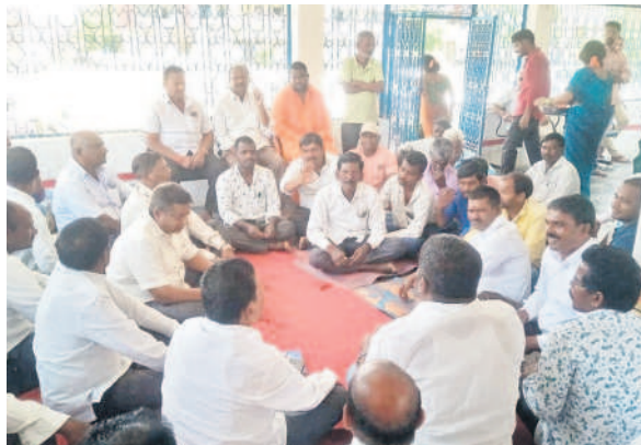
మాట్లాడుతున్న సదరు సంఘ సభ్యులు

కామారెడ్డి, మార్చి 27 : జిల్లా కేంద్రంలోని పట్టణ సదరు సంఘంలో బుధవారం సమావేశం నిర్వహించారు. ఈ సందర్భంగా వారు మాట్లాడుతూ.. ఏప్రిల్ 9వ తేదీ మంగళవారం ఉగాది పండుగను పురస్కరించుకొని జిల్లా కేంద్రంలోని వీధి మార్కెట్లో ఎడలండ్ల ప్రదర్శన నిర్వహిస్తున్నట్లు తెలిపారు. పట్టణంలోని అన్ని కులాల సభ్యులు పాల్గొని విజయవంతం చేయాలని కోరారు. కార్యక్రమంలో పట్టణ అధిపతి సందర్ సంఘం సభ్యులు తదితరులు పాల్గొన్నారు.