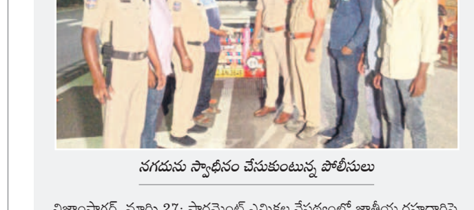
నగదును స్వాధీనం చేసుకుంటున్న పోలీసులు

నిజాంసాగర్, మార్చి 27 : పార్లమెంట్ ఎన్నికల నేపథ్యంలో జాతీయ రహదారిపై వెల్లూరు శివారులో ఏర్పాటు చేసిన అంతర్జిల్లా చెక్ పోస్టు వద్ద మంగళవారం రాత్రి ఓ వాహనంలో తరలిస్తున్న రూ.1.01లక్షల నగదును పట్టుకున్నట్లు ఎన్ఫో సుదాకర్ తెలిపారు. నగదును సంబంధించిన ఏదైనా అధికారులు లేకపోవడంతో నీట్ చేశామని అన్నారు. ఎన్నికల నేపథ్యంలో రూ.50లక్షల మించి నగదును తరలిస్తే అందుకు సంబంధించిన అధికారులు వెంట ఉంచుకోవాలని ఆయన సూచించారు. తనిఖీలో చెక్ పోస్టు వద్ద విద్యులు నిర్వహించే అధికారులతోపాటు పోలీసు సిబ్బంది పాల్గొన్నారు.