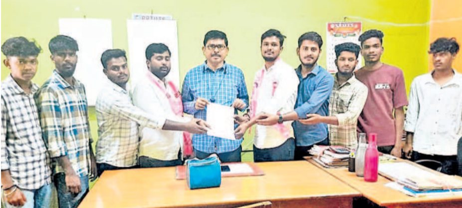
వినతివ్రత అంధజ్యోత్స్వ బీఆర్ఎస్ నాయకులు