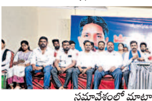
సమావేశంలో మాట్లాడుతున్న మంద కృష్ణ మాదిగ

బస్సెలారీ, మార్చి 27: ఎస్సీ వర్గీకరణ సాధించడమే మాదిగల రాజకీయ ఎజెండా అని ఎమ్మార్సీపీ జాతీయ అధ్యక్షుడు మంద కృష్ణమాదిగ అన్నారు.