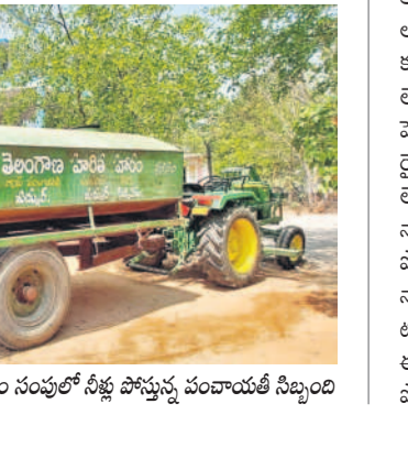
మద్దూరులో ట్యాంకర్ సాయంతో ఎండిపోయిన కార్యాలయం నంపుల్లో నీళ్లు పోస్తున్న పంపాయతీ సీట్లంది

లయానికి నీటి ఇక్కట్లు తప్పడం లేదు. నార్లు. కార్యాలయంలో నీటి కొరత ఏర్పడడంతో కార్యాలయ ఉద్యోగులతో పాటు పంచాయతీలకు చెందిన వాటర్ ట్యాంకర్ల ఇబ్బందులు పడుతున్నాయి.