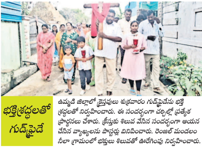
బుడ్డిశ్రద్ధలతో గుడ్ ఫ్రైడే

ఉమ్మడి జిల్లాలో శ్రీకృష్ణులు శుక్రవారం గుడ్ ఫ్రైడేను భక్తి శ్రద్ధలతో నిర్వహించారు. ఈ సందర్భంగా వర్షాల్లో ప్రత్యేక ప్రాధాన్యత వేశారు. క్రీస్తుకు శిలువ వేసిన సందర్భంగా ఆయన చేసిన వ్యాఖ్యలను పాఠ్యపుస్తక వినిపించారు. రెండో మండలం నీలా గ్రామంలో భక్తులు శిలువతో ఊరేగింపు నిర్వహించారు.