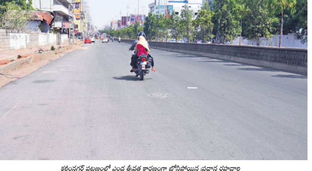
కరీంనగర్ పట్టణంలో ఎండ తీవ్రత కారణంగా బోసిపోయిన ప్రధాన రహదారి

సిద్దిపేట, మార్చి 29 (నమస్తే తెలంగాణ): పవర్ బ్రోకర్లు పార్టీని వీడుతున్నారని హాలీశ్రావు అన్నారు. కార్యకర్తలు వెళ్లటం లేదు. ఇది గాణ ప్రతినిధి: 'అధికారంలో ఉన్న కాంగ్రెస్ పార్టీ కొంతమంది నాయకులను కొన్నా.. తెలంగాణ ఉద్యమకారులు, బీఆర్ఎస్ కార్యకర్తలు, ప్రజలను కొనలేదు. కష్టకాలంలో బీఆర్ఎస్ కు ద్రోహం చేసినాళ్లు కన్నతల్లికి ద్రోహం చేసినట్టే. పోయినవాళ్లు కాళ్లు మొక్కినా మళ్ళీ పార్టీలో చేర్చుకోం. మధ్యలో వచ్చినవాళ్లు, పవర్ బ్రోకర్లు మాత్రమే పోతున్నారు. కార్యకర్తలు వెళ్లటం లేదు. ఇది శిశిరకాలం. పనికిరాని ఆకులు పోతాయి. కొత్త బిగురు వస్తుంది. తెలంగాణ రాష్ట్రం ఉన్నంత వరకు బీఆర్ఎస్ ఉంటుంది' అని మాజీమంత్రి, ఎమ్మెల్యే హాలీశ్రావు అన్నారు. శుక్రవారం మొదటి పార్లమెంట్ పరిధిలోని సిద్దిపేట, దుబ్బాకలో పార్టీ సన్నాహక సమావేశాల్లో హాలీశ్రావు ఆయన.. సిద్దిపేట, దుబ్బాకకు సాగునీరు, తాగునీరు > 4వ పేజీలో