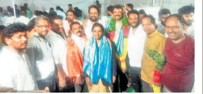
మేడ్చల్ మల్కాజిగిరి బార్ అసోసియేషన్ ఎన్నికల్లో గెలుపొందిన సభ్యులను అభినందిస్తున్న న్యాయవాదులు

రాజకీయ సంక్షోభంలో ఉన్నప్పటికీ కేసీఆర్ తనవేదనలను వైఖరితోనే తమతో గడుపడం కోసం సంతోషంగా ఉన్నాడని అన్నారు. 'కేసీఆర్-ది మ్యాన్ ఆఫ్ ది మిలియన్స్' పుస్తకాన్ని కేసీఆర్ కు అందజేశారు.