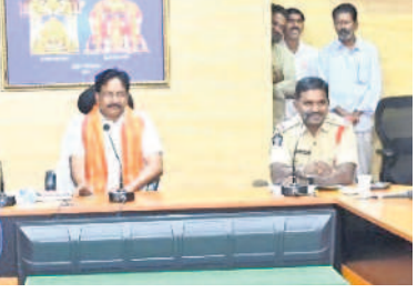
దుఃఖాణాధారులతో మాట్లాడుతున్న ఈవో పెద్దిరాజు

శ్రీశైలం, మార్చి 29 : ఊరికి ఉత్సాహాలకు వచ్చే భక్తులతో స్నేహభావంతో మెలగాలి అలరు ఈవో పెద్దిరాజు దుఃఖాణాధారులకు సూచించారు. శుక్రవారం పరిపాలనా భవనంలో ఇన్ స్పెక్టర్ ప్రసారాపై, ఎస్పీ నవీన్ బాబు, ఏఈవో మల్లికార్జునరెడ్డితో కలిసి ఆయన దుఃఖాణాధారులతో సమావేశమై మాట్లాడారు. కన్నడ భక్తులతో భాషాపరమైన సమస్యలు తలెత్తకుండా వాణిజ్య సముదాయాల వద్ద కన్నడ సీమా సంస్థల ప్రతినిధులను ఏర్పాటు చేస్తామన్నారు. వ్యాపారులు వస్తువులను ఉమ్మార్పి ధరలకే విక్రయించాలని, నిబంధనలు అతిక్రమించిన వారిపై కఠిన చర్యలు తీసుకోవడంతోపాటు ఆలయ వ్యాపార లైసెన్స్, లీజు అగ్రి మెంట్ల రద్దు చేస్తామని హెచ్చరించారు. ప్రధానంగా హోటల్ నిర్వాహకులు పరిసరాలను శుభ్రంగా ఉంచుకోవాలని సూచించారు. ప్రధాన కూడళ్లు, వాణిజ్య సముదాయాల యాత్రికులకు అర్థమయ్యేలా తెలుగు, కన్నడ, హిందీ, ఇంగ్లీష్ భాషల్లో సూచిక బోర్డులు ఏర్పాటు చేయాలని ఆదేశించారు.