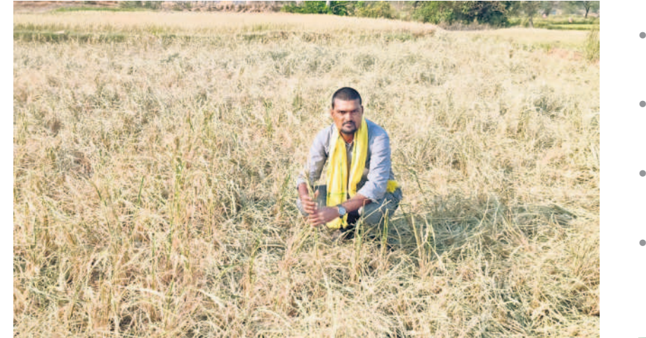
చివరి దశలో నీరుండడం లేదు..