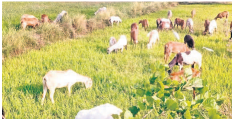
ఎండిన పరి పంటను మేస్తున్న పశువులు, గొర్రెలు

ఎందుకున్న పంటలను చూసి రైతులు గత్యం తరం లేక తమ పశువులను పొలాల్లో మేపుతున్నారు. మరికొందరు పంటలను ముందుగానే కొని పశు