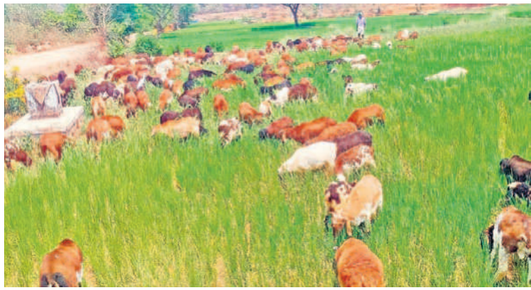
కొలిమికుచ్చతండాన మీపంలో ఎండిన పరి పంటను గొర్రెలకు పదిలేసిన రైతులు