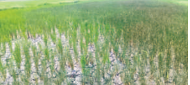
జడ్పీ మండలం మల్లెబోయిపల్లి గ్రామం సమీపంలో నెల్రెలుబారిన వరి పొలం