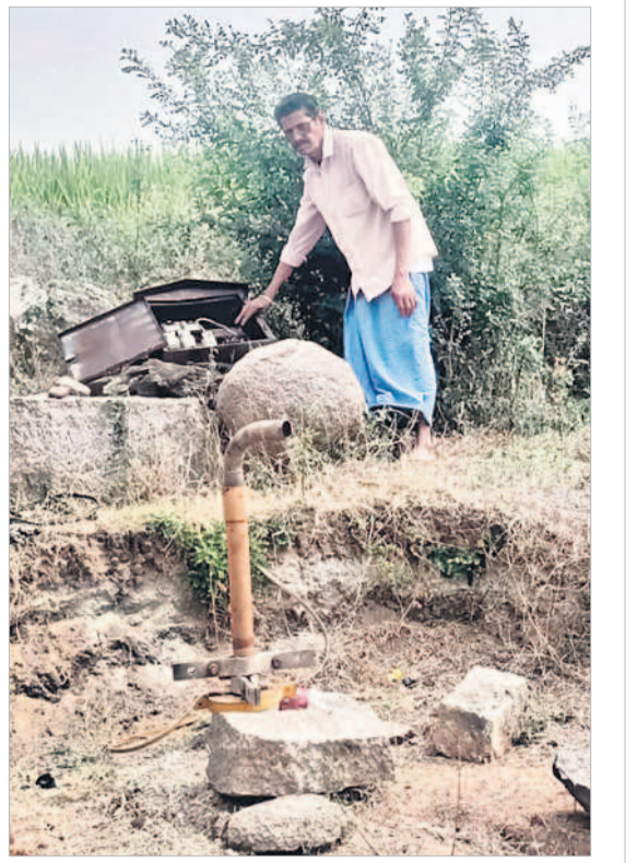
వట్టిపోయిన బోరును చూపిస్తున్న బానోకరెడ్డి