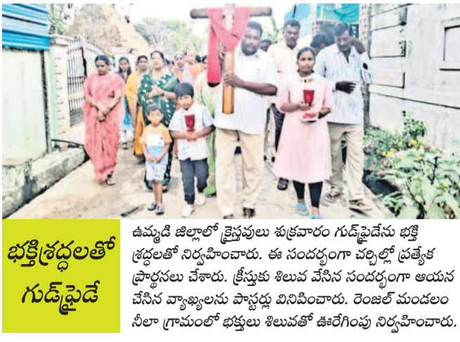
భక్తిశ్రద్ధలతో గుడ్ ఫ్రైడే

ఉమ్మడి జిల్లాలో శ్రీకృష్ణులు శుక్రవారం గుడ్ ఫ్రైడేను భక్తి శ్రద్ధలతో నిర్వహించారు. ఈ సందర్భంగా వర్షాల్లో ప్రత్యేక ప్రాధాన్యత వేశారు. క్రీస్తుకు శిలువ వేసిన సందర్భంగా ఆయన చేసిన వ్యాఖ్యలను పాఠ్యపుస్తక వినిపించారు. రెంజిల్ మండలం నీలా గ్రామంలో భక్తులు శిలువతో ఊరేగింపు నిర్వహించారు.