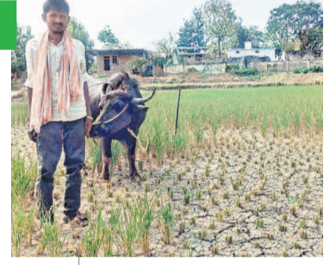
-లాల్, సోమార్ పేట, మాచారెడ్డి మండలం

నాకున్న రెండెకరాల భూమిలో ఒక బోరు మోటరు ఉన్నది. ఎకరం పంట పోయిన పంట వేసిన. పంటకు సరిపడా నీళ్లు అందక పూర్తిగా ఎండిపోయింది. బోర్లలో నీళ్లు లేక మోటరు నడిపించే సరికి మోటరు కూడా కాలిపోయింది. రూ.12 వేలు పెట్టి చేయించిన నీళ్లు రావడం లేదు. చేసేది లేక ఎండిన పొలంలో పశువులను మేపుతున్నా. పంట పెట్టుబడి కోసం రూ.15 వేలు అప్పు చేసిన. మా గ్రామంలో రైతులందరి పరిస్థితి ఇలాగే ఉన్నది. భూమిని నమ్ముకొని బతికే రైతులకు ఇలాంటి కష్టం వస్తే ఎలా ముందుకెళ్ళేది.