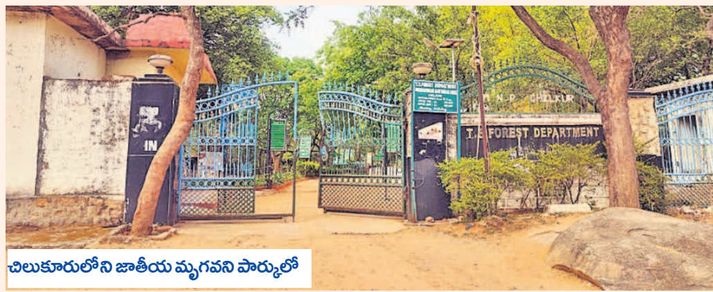
చిలుకూరులోని జాతీయ మృగవన పార్కులో