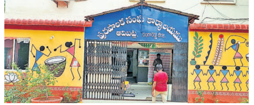
అదిబట్ల మున్సిపల్ కార్యాలయం