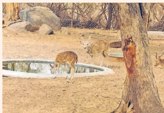
సీటి తొట్టలోని సీటిని తాగుతున్న జింకలు

మంచుకున్న ఎండలో మాస కుంటల తవ్వకంతోపాటు అటవీలోని పలు ప్రాంతాల్లో సాసర్ పిట్ల పర్యటనలు మొదలుపెట్టినట్లు తెలుస్తోంది. అడవిలో ఉన్న వన్యప్రాణుల సంరక్షణలో అటవీలోని అధికారులు ముందస్తు చర్యలు తీసుకున్నారు. మంచు కుంటలలోని చిలుకూరు రెవెన్యూ సాసర్ పిట్లను మృగవన పార్కులోని వన్యప్రాణుల దాహాన్ని తీర్చేందుకు కుంటలను తవ్వించారు. వర్షాకాలంలో పడిన ప్రతి చుక్కానీరూ సాసర్ పిట్లకు తీసుకువచ్చారు. దీంతో అటవీలో సంచరించే జింకలు, దుప్పలు తమ దాహాన్ని తీర్చుకుంటు