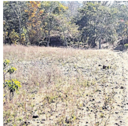
చాప్రాల గ్రామానికి వెళ్లే దారి

ఉట్టూర్, మార్చి 30 : ఉట్టూర్ మండలం చాప్రాల గ్రామంలో సమస్యలు రాజ్యమేలుతున్నాయి. కనీస సౌకర్యాలు లేక గిరిజనులు ఇబ్బందులు పడుతున్నారు. గ్రామం ఏర్పడి సంవత్సరాలు గడుస్తున్న అధికారులు కనీస సౌకర్యాలైన తాగునీరు, రోడ్లు, వైద్యం, పాఠశాల వసతులు కల్పించలేదని గిరిజనులు వాపోతున్నారు. గ్రామానికి రోడ్డు సౌకర్యం లేక కాలినడకనే వెళ్లాల్సి వస్తోంది. ప్రభుత్వం లక్షల రూపాయలు ఖర్చు చేసి కొనుగోలు చేసిన 104, 108 వానానాలు రోడ్డు లేకపోవడంతో తమకు అందని ద్రాక్షలాగే మిగిలింది. వ్యాధులు