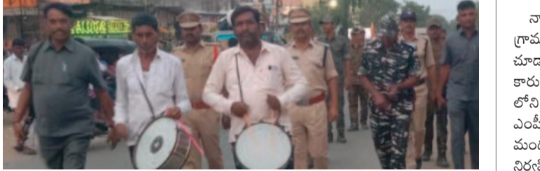
ఇంద్రవెల్లిలో కవాతు నిర్వహిస్తున్న ప్రత్యేక బలగాలు