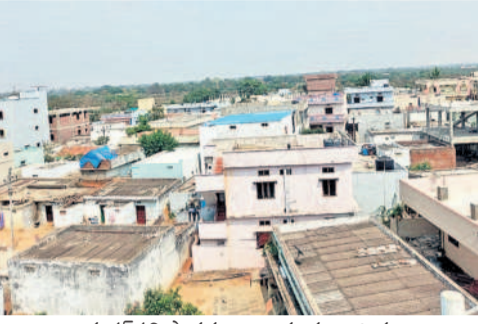
మదన్పల్లి పాతతండా గ్రామ ముఖ చిత్రం

శంషాబాద్ రూరల్, మార్చి 30 : 2018 నుంచి నేటి వరకు ప్రతి సంవత్సరం వందశాతం ఆస్తి పన్ను వసూలు చేసిన మదన్పల్లి పాతతండా మండలం అత్యధిక వసూలు చేసిన మండలం అయింది. నూటికి నూరుశాతం ఆస్తి పన్ను వసూలు చేయాలని ప్రభుత్వ ఆదేశాల మేరకు ప్రజా ప్రతినిధులు, అధికారులు కలిసి కట్టుగా పనిచేసి వంద శాతం ఆస్తిపన్ను వసూలు చేసి రంగారెడ్డి జిల్లాలోనే మొదటి వరుసలో నిలిచారు. మొత్తం 700 జనాభా కలిగిన మదన్పల్లి పాతతండా నేడు ఆదర్శంగా నిలిచింది. మండలంలో 9 గ్రామ పంచాయతీలలో కూడా వందశాతం ఆస్తిపన్ను వసూలు పూర్తి చేశారు. అప్పటి నుంచి కేసీఆర్ 500 జనాభా ఉన్న గిరిజన