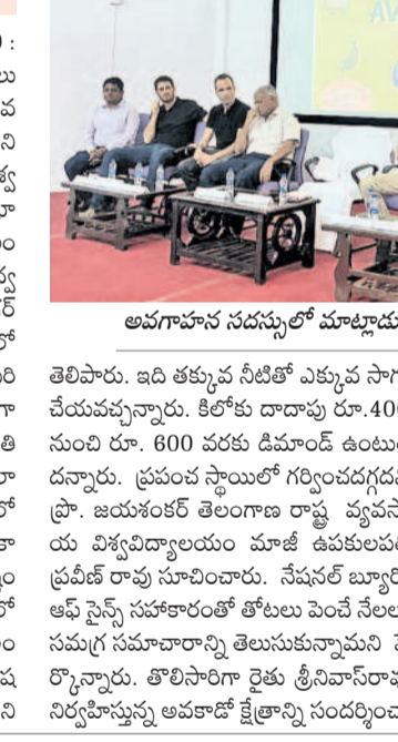
అవగాహన సదస్సులో మాట్లాడుతున్న వీసీ నీరజా ప్రభాకర్, తదితరులు