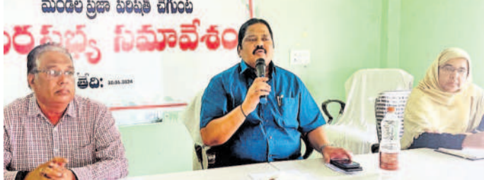
చేగుంట సమావేశంలో మాట్లాడుతున్న మెడక్ అదనపు కలెక్టర్ రమేష్

చేగుంట, మార్చి 30: వేసవిలో ప్రజలకు తాగు నీటి ఇబ్బందులు లేకుండా చర్యలు చేపట్టాలి మెడక్ అదనపు కలెక్టర్ రమేష్ తెలిపారు. చేగుంటలోని ఎంపీ సమావేశ మందిరంలో ఏర్పాటు చేసిన సమావేశంలో ఆయన మాట్లాడారు.