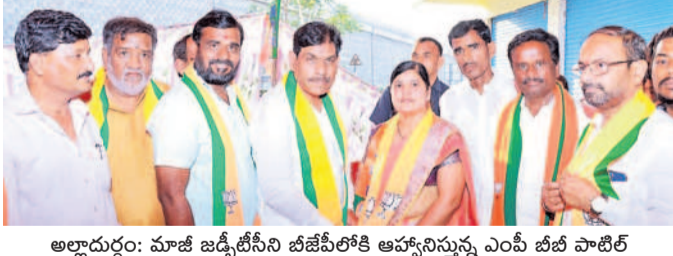
అల్లూరు: మాజీ జడ్పీటీసీ బిజినీటికి ఆహ్వానిస్తున్న ఎంపీ బీబీ బీబీ పాటిల్

పెద్దశంకరంపేట, మార్చి 30: ప్రధాని మోదీ ఆధ్వర్యంలో మూడోసారి కేంద్రంలో బీజేపీ ప్రభుత్వం ఏర్పాటు కావడం భాయమని జిల్లా కలెక్టర్ రావు తెలిపారు.