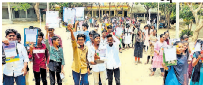
నర్సాపూర్లో పరీక్ష రాసి బయటకు వస్తున్న విద్యార్థులు

మెడక్ మున్సిపాలిటీ/చేగుంట, మార్చి 30: పది తరగతి పరీక్షలు ఈనెల 18న ప్రారంభమై శనివారం ముగిసాయి. చివరి రోజు సాంఘికశాస్త్రం పరీక్ష సజావుగా జరిగింది.