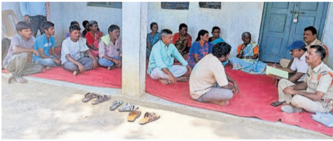
గ్రామస్థులతో మాట్లాడుతున్న ఎమ్మెల్యే, ఏఎన్టీ, ఆర్ఐఐ