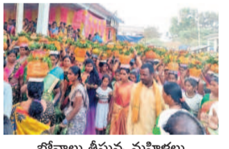
బోనాలు తీస్తున్న మహిళలు

బోనాలు, మార్చి 30: మండల కేంద్రంలో అనాదిగా వస్తున్న అచారంలో భాగంగా దుర్గమ్మ పోచమ్మ జాతర శనివారం వైభవంగా ప్రారంభమైంది.