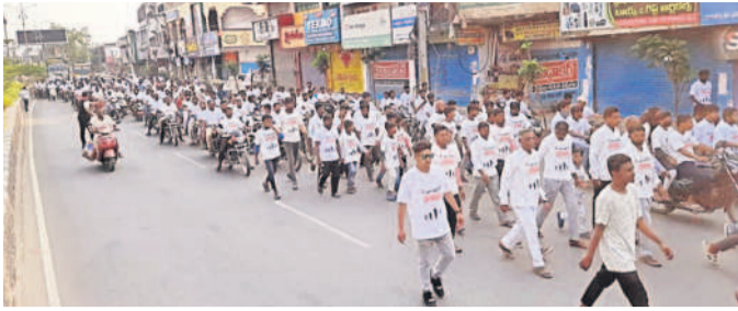
రన్ ఫర్ జీసస్ ర్యాలీలో పాల్గొన్న క్రైస్తవులు

మెడక్ మున్సిపాలిటీ, మార్చి 30: మెడక్ సీఎస్ఐ కమిటీ ఆధ్వర్యంలో శనివారం ఉదయం రన్ ఫర్ జీసస్ (యేసు క్రీస్తు పరుగు) ర్యాలీని శనివారం నిర్వహించారు.