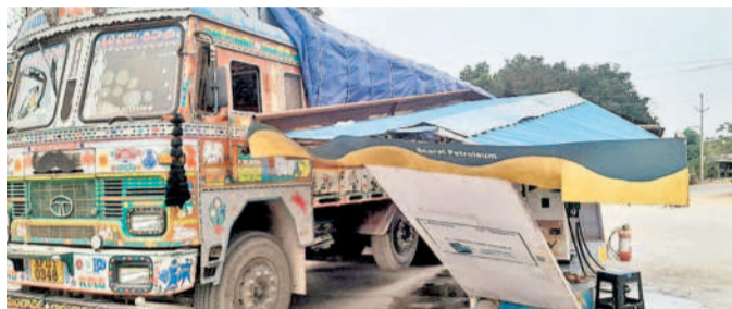
లారీ డీకొట్టడంతో ధ్వంసమైన పెట్రోల్ బంకు

రామాయంపేట, మార్చి 30: లారీ అదుపు తప్పి పెట్రోల్ బంకును డీకొట్టిన ఘటన రామాయంపేట పోలీస్ స్టేషన్ పరిధిలోని పట్టణ శివారులో శుక్రవారం రాత్రి జరిగింది.