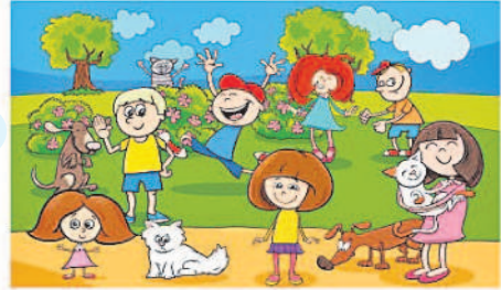
ఒకటా కనిపిస్తున్న ఈ రెండు చిత్రాల్లో 7 తేదాలున్నాయి. అవేంటో కనిపెట్టండి.