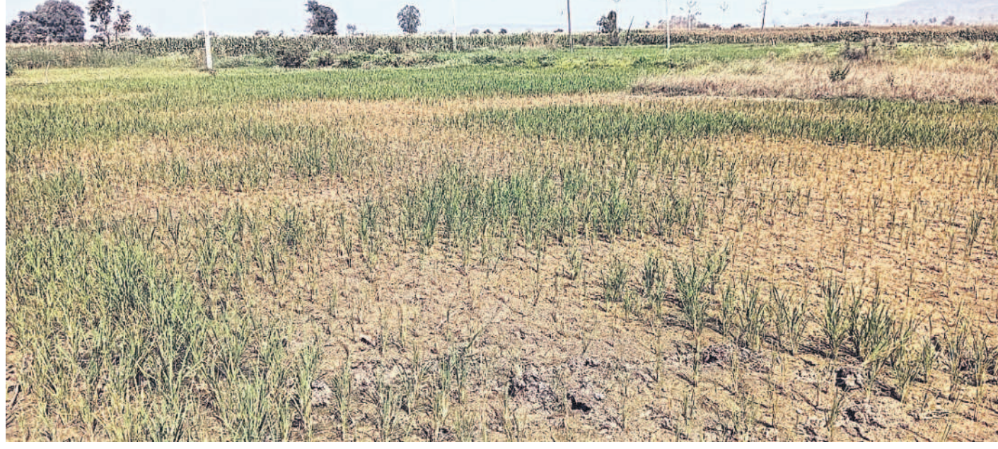
సారంగాపూర్ మండలం జామీ గ్రామంలో వీరందక ఎండుతున్న వరి పంట

ఎస్సీ, ఎస్టీ, మైనార్టీ, బీసీ గురుకులాల్లో ఉద్యోగాలు నియామక ప్రక్రియ బాగానే ఉన్నా.. నిబంధనలు పాత కావడంతో మార్చాలన్నా డిమాండ్ చేస్తున్నారు. ఉద్యోగాలను మెరిట్ పరీక్షలు రాసిన వారిలో ఒక్కో మిగతా ఉద్యోగాలు వదిలితే.. ఆ తరువాత మెరిట్ ఉన్న అభ్యర్థులను ఉద్యోగాలకు ఎంపిక చేయాలి. ఇలా చేయక పోవడం వల్ల చివరి నిమిషంలో ఉద్యోగం రాని వారు తీవ్ర మనోవేదన చెందుతున్నారు. ప్రభుత్వం అవసరమైతే మంత్రి వర్గ సమావేశాన్ని ఏర్పాటు చేసి, నిబంధనలు సవరించేలా చర్యలు తీసుకోవాలి. ఉద్యోగాలు కల్పించడం ప్రభుత్వం బాధ్యతగా గ్రహించాలి. ఇప్పటికే కొందరు అభ్యర్థులు కోర్టును కూడా ఆశ్రయించారు. - వేణుకొండ, ప్రైవేట్ ల్యాబ్ వారు, సిద్ధి.