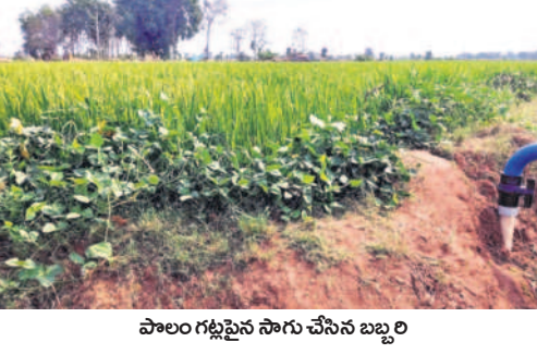
పాలం గట్లపై సాగు చేసిన బబ్బలి

ఉంది. తొలగించాలన్న డబ్బు, శ్రమ వృధా అవుతాయి. కానీ.. మండలంలోని రేపాటిపాడు గ్రామానికి చెందిన దాదాపు 10 మంది రైతులు నూతన పద్ధతి ద్వారా వరి సాగు చేస్తున్నారు. కొన్నేండ్లగా పడెకలాల్లో బబ్బలి సాగు చేస్తున్నారు. పాలం గట్లపై బబ్బలి అంతర పంటగా వేస్తూ.. రెండో ఆదాయం పొందుతున్నారు. మార్కెట్లో విక్రయించి అల్లకంగా ప్రయోజనం పొందుతున్నారు. ఒక్క ఎకరానికి ఆదాయం రూ.5వేల నుంచి రూ.10వేల వరకు వస్తుందని రైతులు పేర్కొంటున్నారు. ఈ దిశగా మిగతా రైతులు ఆలోచించి పాలం గట్లపై అంతర పంటలు వేసుకుంటే శ్రమ, ఖర్చును ఆదా చేసుకోవచ్చు.