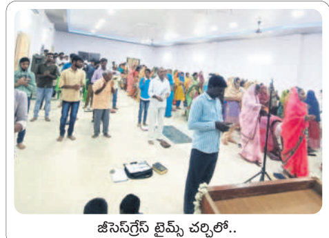
జీసస్ గ్రేస్ బ్రీమ్ చర్చిలో..