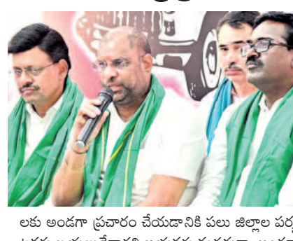
ముందుచూపు లేని కారణంగానే కరువు