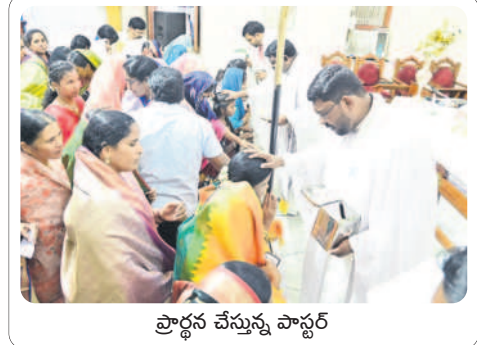
ప్రార్థన చేస్తున్న పాస్టర్