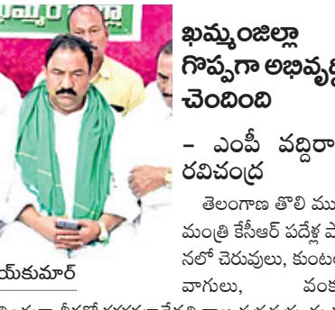
ఖమ్మం జిల్లా గొప్పగా అభివృద్ధి చెందింది

- ఎంపీ నామా నాగేశ్వరరావు తెలంగాణ రైతుబిడ్డా రైతుల కష్టాలు దగ్గరగా చూసిన వ్యక్తిగా ఇవాళ రాష్ట్రంలో ఉన్న సమస్యలను చూసి చాలా బాధపడుతున్నానని బీఆర్ఎస్ లోక్ సభా పక్షనేత, ఖమ్మం ఎంపీ నామా నాగేశ్వరరావు అన్నారు. జిల్లా ప్రజలకు రైతుబిడ్డా సాయం వేదామని మాత్రమే రాజకీయాల్లోకి వచ్చానన్నారు. కాంగ్రెస్ పార్టీకి ఓటు వేసి తప్పు చేశామని రైతులు ఇప్పుడు తలుపు బుచ్చుకుంటున్నారని అన్నారు. పంట పొట్టు దశకు వచ్చిందని ఒక్క తడి నీరు వదిలి ఉంటే పంట చేతికి వచ్చేదని నేలకొండపల్లిలో ఓ రైతు కన్నీరు పెట్టుకున్నాడని పేర్కొన్నారు. కేసీఆర్ హయాంలో బియ్యం ఎగుమతుల్లో రాష్ట్రం నెంబర్ వన్ స్థానంలో నిలిచిందన్నారు. తెలంగాణ రాష్ట్రాన్ని ఎలా ముందుకు తీసుకొచ్చామో, రైతుల పక్షాన అలానే నిలుస్తామన్నారు. పార్లమెంట్ ఎన్నికల్లో 14 ఎంపీ సీట్లలో బీఆర్ఎస్ ను గెలిపించి కేసీఆర్ కు అండగా నిలవాలన్నారు.