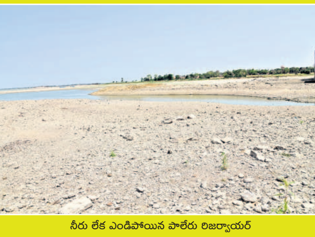
నీరు లేక ఎండిపోయిన పాలేరు రిజర్వాయర్

తాము ఐదికారాల్లో వేసిన పరిష్కారం ఎండిపోయిన రైతులకు తమ ఆవేదనను, ఆందోళనను పార్టీ నేతలముందు వెలిబుచ్చాలని కోరారు. గతంలో ఈ తరహా దుర్భర పరిస్థితులు ఈ ప్రాంత రైతులు ఎప్పుడూ ఎదుర్కొనేదేనని ఆవేదన వ్యక్తం చేశారు. కాంగ్రెస్ ప్రభుత్వంపై ప్రజలకు ఉన్న భ్రమలు తొలగిపోయాయని అన్నారు. బీఆర్ఎస్ ప్రతినిధి బృందం రైతును ఓదార్చి పార్టీ అండగా ఉంటుందని, కాంగ్రెస్ పార్టీ వైఖరి పట్ల బీఆర్ఎస్ అధినేత కేసీఆర్ అండగా ఉంటారని వాస్తవం ప్రకటించారు.