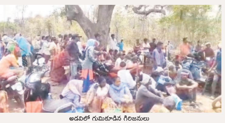
అడవిలో గుమికూడిన గిరిజనులు