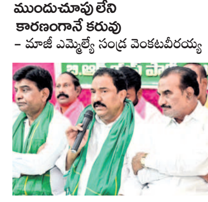
జిల్లా ప్రజల పక్షాన బీఆర్ఎస్ నిలబడుతుంది