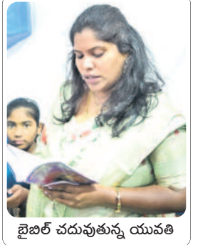
బైబిల్ చదువుతున్న యువతి