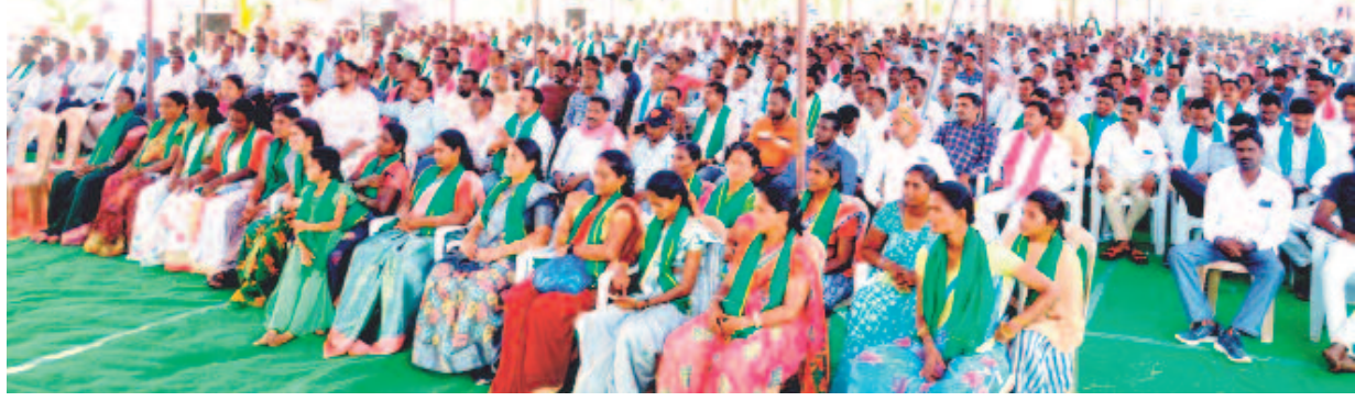
దీక్షకు హాజరైన నాయకులు, కార్యకర్తలు, రైతులు