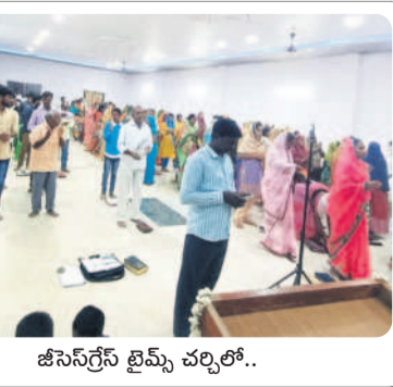
జీసస్ గ్రేస్ బ్రీమ్ చర్చిలో..