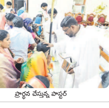
ప్రార్థన చేస్తున్న పాస్టర్