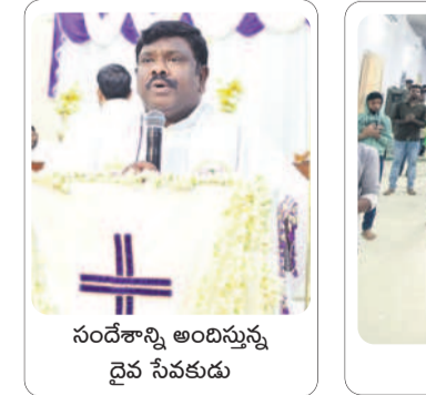
సందేశాన్ని అందిస్తున్న దైవ సేవకుడు