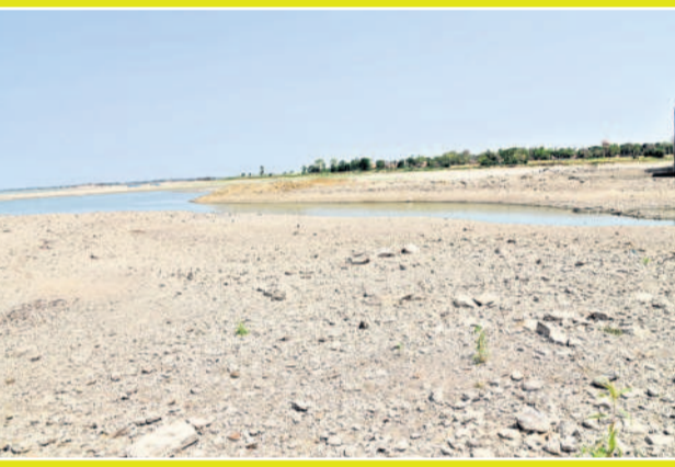
నీరు లేక ఎండిపోయిన పాలేరు రిజర్వాయర్