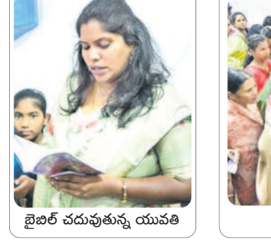
బైబిల్ చదువుతున్న యువతి