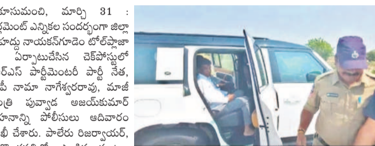
నాయక్ గూడెం చెక్ పోస్టు వద్ద ఎంపీ నామా కారును తనిఖీ చేస్తున్న పోలీసులు

కూసుమంచి, మార్చి 31 : పార్లమెంట్ ఎన్నికల సందర్భంగా జిల్లా సరిహద్దు నాయక్ గూడెం లోల్లోపూజా వద్ద ఏర్పాటుచేసిన చెక్ పోస్టులో బీఆర్ఎస్ పార్టీమెంబర్ పార్టీ నేత, ఎంపీ నామా నాగేశ్వరరావు, మాజీ మంత్రి పువ్వాడ అజయ్ కుమార్ వాహనాన్ని పోలీసులు ఆదివారం తనిఖీ చేశారు. పాలేరు రిజర్వాయర్, నేలకొండపల్లిలో ఎండిన పంటల పరిశీలకుల వచ్చిన నాయకుల వాహనాలను తనిఖీ చేశారు.