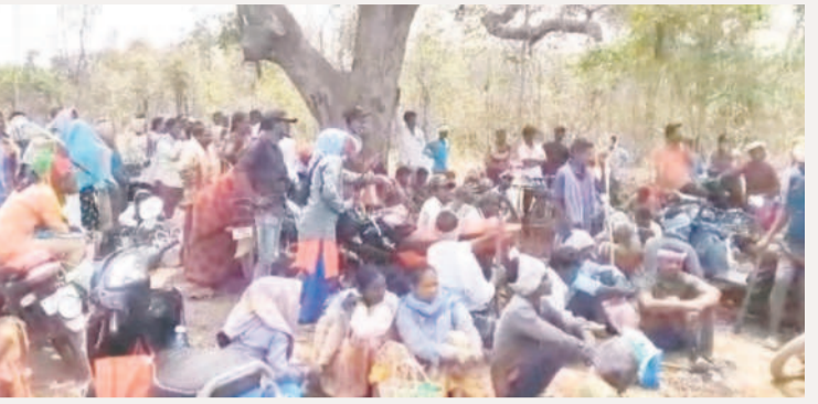
అడవిలో గుమికూడిన గిరిజనులు