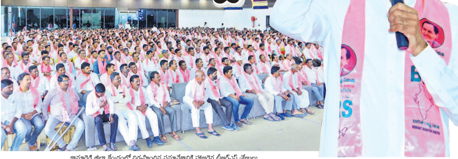
కామారెడ్డి జిల్లా కేంద్రంలో నిర్వహించిన సమావేశానికి హాజరైన బీఆర్ఎస్ శ్రేణులు