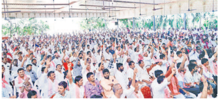
లింగంపేట్ సమావేశంలో పాల్గొన్న బీఆర్ఎస్ శ్రేణులు