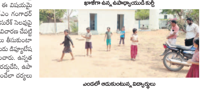
పాఠశాల ఆవరణలో తిరుగుతున్న విద్యార్థులు