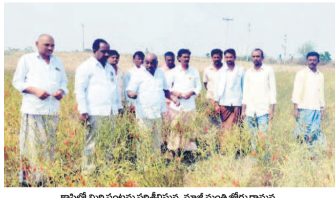
కాప్రిలో మిర్చి పంటను పరిశీలిస్తున్న మాజీ మంత్రి జోగు రామన్న