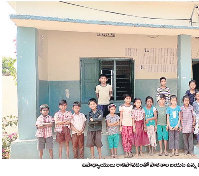
ఉపాధ్యాయులు రాకపోవడంతో పాఠశాల బయట ఉన్న విద్యార్థులు