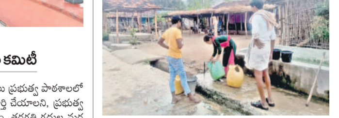
లింగాడలో నీటిని పట్టుకుంటున్న గ్రామస్థులు