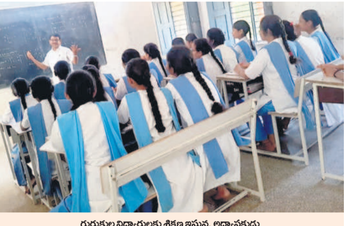
గురుకుల విద్యార్థులకు శిక్షణ ఇస్తున్న అధ్యాపకుడు

నిర్వహణ కమిటీ సమావేశం నిర్వహణ కమిటీ సమావేశం