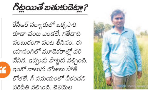
కేసీఆర్ సర్కారులో ఒక్కసారి కూడా పంట ఎండలే. గతేడాది నంబురంగా పంట తీసినం. ఈ యాసంగిలో మూడెకరాల్లో వరి వేసిన. ఇప్పుడు పొట్లకు వరి వచ్చింది.

గతేడాది నాకున్న మూడెకరాలతో పాటు మరో ఐదు ఎకరాలు కొలుకు తీసుకొని వరి వేసిన. కేసీఆర్ సర్కారు పట్టణం వరకు వరి పంట పండితేనే, కరెంట్ ఉంటుందో.. ఉండదోనని అసేరే నాకున్న మూడెకరాల్లోనే వరి సాగు చేసిన. అనుకున్నట్లే ప్రాజెక్టు నుంచి కాలువల ద్వారా నీరు అందడం లేదు.