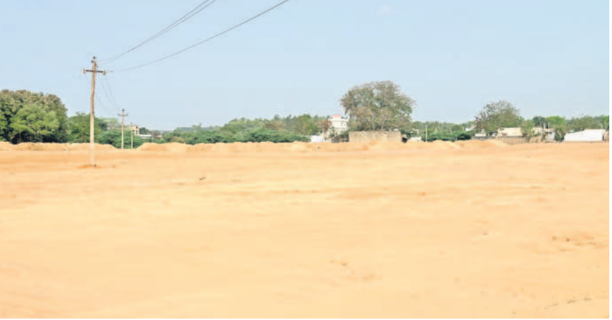
సంగమల్లయ్యపల్లెలో అక్రమ లే అవుట్

మంచిర్యాల, ఏప్రిల్ 1 (నమస్తే తెలంగాణ ప్రతినీధి) : సన్సార్ మున్సిపాలిటీ పరిధిలోని సంగమల్లయ్యపల్లెలో సింగరేణి భూమి కబ్జా చేయడమేకాక.. జైహూర్ ఓసీపీ నుంచి వందలాది లాబిలో మట్టిని తీసుకొచ్చి అక్రమ లే అవుట్ చేస్తున్నా అధికారులు చూసినందువల్లు వ్యవహారించడం విమర్శలకు తావిస్తున్నది.