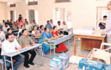
అవగాహన కల్పిస్తున్న ప్రైవింగ్ అధికారి