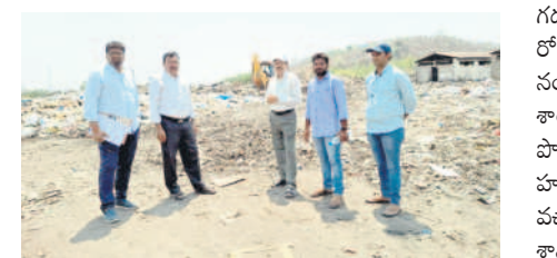
డంప్ యార్డును పరిశీలించే సమయంలో కల్లెవర్ బోర్డు అధికారులు, మున్సిపల్ అధికారులు