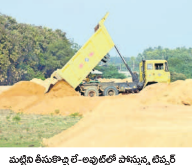
మట్టిని తీసుకొచ్చి లే అవుట్లో పోస్టునీ టిప్పర్

కాగా, ఈ వెంచర్లో పోస్టును మట్టి జైహూర్ ఓసీపీ నుంచి లాబి అనుమతులు లేకుండా తరలించినట్లు సమాచారం. ఈ విషయమై యాజమానులను వివరణ కోరగా, ఓ కాంట్రాక్టర్ నుంచి తెలుసుకుంటే రూ.3500 ఇచ్చి మట్టి తెప్పిస్తున్నామని అన్నారు.