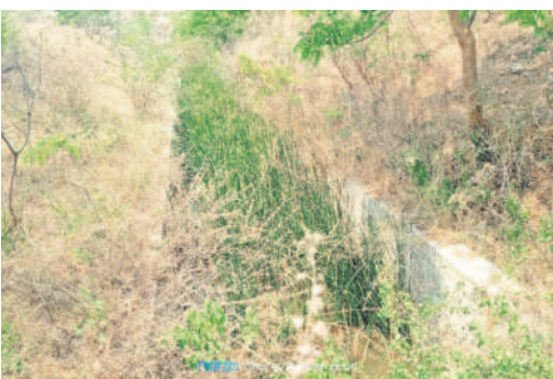
పల్చిముక్కలతో నిండిపోయిన కాలువ

కుమ్రం టీం ఆసిఫాబాద్ (నమస్తే తెలంగాణ)/తిర్యాణి, ఏప్రిల్ 1 : తిర్యాణి మండల రైతుల పరిస్థితి అగమ్యగోచరంగా మారింది. చెలిమల ప్రాజెక్టు నీరు రాక... కరెంట్ సరిగా లేక పాట్లదశలో ఉన్న వరి చేతికం దకుండా పోయే దుస్థితి నెలకొంది.