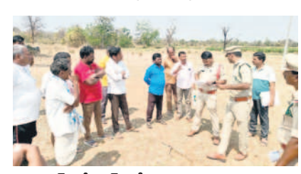
ఎఫ్ఆర్డీ, ఎన్ఐఓ మాట్లాడుతున్న రైతులు