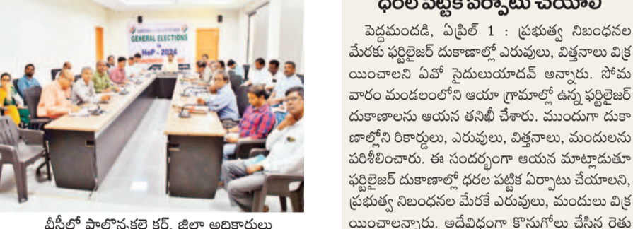
వీటిలో పాల్గొన్న కలెక్టర్, జిల్లా అధికారులు