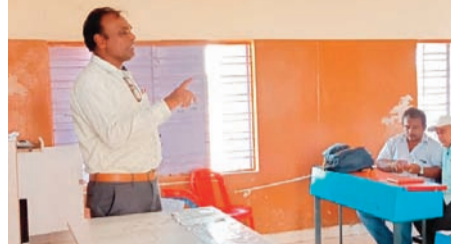
శిక్షణ కార్యక్రమంలో పాల్గొన్న అధికారులు

గద్యాల, ఏప్రిల్ 1 : పాపెమ్మపేట ఎన్నికలను పక్కనబెట్టి, పార్లమెంటు నిర్వహించేందుకు ఈవీఎంల పనితీరుపై పూర్తి అవగాహన కలిగి ఉండాలని అదనపు కలెక్టర్ అభ్యర్థనాచోహన ట్రైనింగ్ అధికారులకు సూచించారు. జిల్లా కేంద్రంలోని ప్రభుత్వ ఎంపీఎల్డీ కళాశాలలో సోమవారం ట్రైనింగ్ అధికారులకు ఏర్పాటు చేసిన మొదటి రోజు శిక్షణ కార్యక్రమంలో అదనపు కలెక్టర్ పాల్గొని మాట్లాడారు. ఎన్నికల్లో ట్రైనింగ్ అధికారుల పాత్ర కీలకమని ఎన్నికల సంఘం సూచనల మేరకు అధికారులు సంపూర్ణ అవగాహన కలిగి ఉండి నియమాలను పాటించి ఎన్నికల సంఘం జారీ చేస్తున్న నూతన నిబంధనల ప్రకారం ఎన్నికలను నిర్వహించాలన్నారు. ఎన్నికల విధులపై నిర్దిష్ట పరిచయం ఉండాలని పోలింగ్ సందర్భంగా నిర్వహించాల్సిన విధులపై పూర్తి అవగాహన ఉండాలన్నారు. శిక్షణ పొందిన రోజు నుంచి పోలింగ్