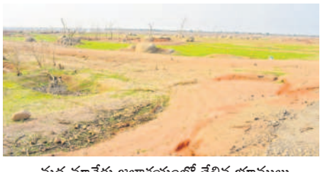
మధ్యమానేరు జలాశయంలో తేలిచ భూములు