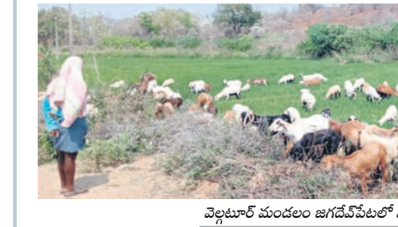
వెల్లూర్ మండలం జగదేవపేటలో ఎండిపోయిన పొలాల్లో మేస్తున్న గొడ్డు

నాటి సమైక్య పాలనలో వట్టిపోయిన వరదకాలువి శ్రీరాంసాగర్ ప్రాజెక్టుకు కాశ్యప్ జలాశయం తిరిగి జీవం పోయడంతోపాటు వరద కాలువను జీవనదిలా మార్చే లక్ష్యంతో కేసీఆర్ సర్కారు ఎస్సారెస్సీ పునర్నిర్మణ పథకాన్ని తెచ్చింది. కాశ్యప్ జలాశయం ఎత్తిపోసి 122 కిలోమీటర్ల పొడవునా వరదకాలువను నిండుకుండలా మార్చింది. వరద కాలువకు తూములు ఏర్పాటు చేసి, వందలాది చెరువులు నింపుకోనే మార్గాన్ని సృష్టించింది. దీంతో వేసవిలో మండలంపేట ఇబ్రహీంపట్నం, మేట్లపల్లి, కథలాపూర్, మేడిపల్లి, మల్లాల మండలాలకు మేలు జరిగింది. ఏప్రిల్, మేలో సైతం చెరువులు మత్తళ్లు దూకాయి. అయితే కాంగ్రెస్ సర్కారు మేడి గడ్డ బరాకోలో మూడు పిల్లలకు పగుళ్లు వచ్చాయన్న సాకుతో కేకలేత్తేయంగా.. ఎస్సారెస్సీ పునర్నిర్మణ పథకం వినియోగించలేని దుస్థితి వచ్చింది.