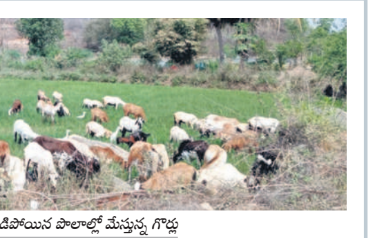
వెల్లూర్ మండలం జగదేవపేటలో ఎండిపోయిన పొలాల్లో మేస్తున్న గొడ్డు

రాజన్న సిరిసిల్ల, ఏప్రిల్ 2 (సమస్తీ తెలంగాణ): కాశ్యప్ జలాశయం కాకతీయ కాలువకు ఆరువేల క్యూసెక్కుల నీటిని విడుదల చేస్తున్నా పంటలు చేతికొచ్చే పరిస్థితి మాత్రం కనిపించడం లేదు. అయితే కాకతీయ కాలువ పరిధిలోని పంటలకు ఇదే చివరి తడి అని, మరో తడి నీరు ఇచ్చే పరిస్థితి లేదని, ప్రాజెక్టులో తాగునీటికి సరిపోయే నీరు సైతం సరిగా లేదని అధికారులు ప్రకటించడం భయపెడుతున్నది. మరో నీటి తడి వచ్చే పరిస్థితి లేకపోవడంతో ఆయకట్టు పరిధిలోని రైతాంగం ఆందోళన చెందుతున్నది. ఇటు పోయినేడు ఏప్రిల్ లో శ్రీరాజాశెట్టల (మధ్యమానేరు) రిజర్వాయర్ లో 20 టీఎంసీలు ఉండగా, ప్రస్తుతం 7.7 టీఎంసీలకు పడిపోయింది. గతేడాది మండలంపేటలోనూ 32 అడుగుల నీటి నిల్వ సామర్థ్యంతో మత్తడి దుంకిన ఎగువ మానేరు, ఇప్పుడు 19 అడుగులకు పడిపోయింది. ఎలేండి పరిస్థితి కూడా దారుణంగా ఉన్నది. 24 టీఎంసీలకు గాను ప్రస్తుతం 5 టీఎంసీల నీరే ఉండగా, కాకతీయ కాలువకు నీటి విడుదలను ఇప్పటికే నిలిపివేశారు. ఇటు కరీంనగర్ లో ఇప్పటికే తాగునీటి సమస్య మొదలు కాగా, కొన్ని డివిజన్ లో ట్యాంకర్ల ద్వారా నీటిని అందిస్తున్నారు.