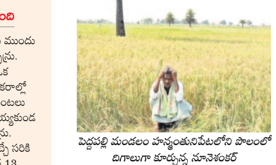
పెద్దపల్లి మండలం హన్మంతునిపేటలోని పొలాలలో డిగాలుగా కూర్చున్న సూర్యవంశీ

జగిత్యాల, ఏప్రిల్ 2(సమస్తీ తెలంగాణ): జగిత్యాల జిల్లాలో ఈ యాసంగి సీజన్ లో 2,97,654 ఎకరాల్లో వరి సాగు చేయగా, ఎస్సారెస్సీ కాకతీయ కాలువ కింద 14 మండలాల పరిధిలో 1,77,563 ఎకరాల్లో పంటలు వేశారు. అయితే ప్రభుత్వ నిర్లక్ష్యంతో యాసంగి పంట ఇయ్యండికరమైన పరిస్థితిని ఎదుర్కొంటున్నది. ఎస్సారెస్సీలో నీటి నిల్వలు తగ్గుతుండడం, సాగునీరు వచ్చే పరిస్థితి లేక బీరెండ్ (చివరి ఆయకట్టు) ప్రశ్నార్థకంగా మారుతున్నది. కాకతీయ కాలువకు ఆరువేల క్యూసెక్కుల నీరు విడుదల చేస్తున్నా.. పంటలు దక్కే పరిస్థితి కనిపించడం లేదు. మరో తడి ఇస్తే గానీ పంటలు రక్షించుకోలేమని, ఇప్పుడున్న పరిస్థితుల్లో మరో తడి వచ్చేలా లేదని, పంటలను కాపాడుకోవడం ఎలా అంటూ రైతాంగం వాపోతున్నది. ఇక చెరువులపై అధికార చడి సాగు చేస్తున్న 58వేల ఎకరాల్లో వరి ఎండిపోయే ముప్పు కనిపిస్తున్నది. ఎస్సారెస్సీ ఆయకట్టు చివరి ప్రాంతాలతో పాటు, వరద కాలువ పరిహారక ప్రాంతంలో పంటలకు సాగునీరందక ఎండిపోతున్నాయి. డి-83 కాలువ ద్వారా వచ్చే ఎస్సారెస్సీ నీరు ధర్మపురి మండలం పొగపల్లి, గొల్లపల్లి, వెల్లూర్ మండలాలకు చేరుతుంది. గొల్లపల్లి మండలం రంగదామునిపల్లిలో ఉన్న రిజర్వాయర్ కు డి-83 ద్వారా నీరు చేరుతాయి. అక్కడి నుంచి నీరు చిల్లకోడూరు వారు