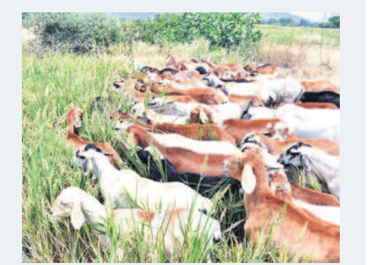
ఇల్లంతకుంట మండలం అనంతారంలో ఎండిన పంటను మేస్తున్న గొర్రెలు