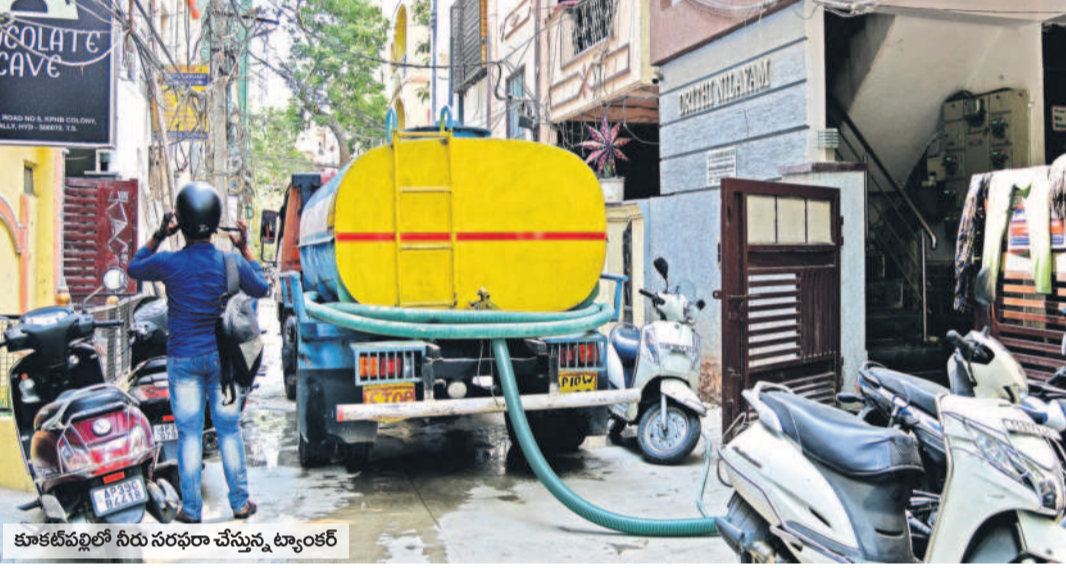
కూకట్లపల్లిలో నీరు సరఫరా చేస్తున్న ట్యాంకర్