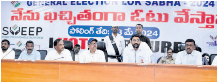
అధికారులతో మాట్లాడుతున్న కలెక్టర్ జితేష్ వీ పాటిల్

కామారెడ్డి, ఏప్రిల్ 2 : వేసవి సెలవులు ముగిసేలోగా జిల్లాలోని ఆయా పాఠశాలల్లో మరమ్మత్తు పనులు పూర్తి చేయాలని కలెక్టర్ జితేష్ వీ పాటిల్ ఆదేశించారు. అమ్మ ఆదర్శ పాఠశాల అమలు, కమిటీల ఏర్పాటు, పనులు చేయించే విధానంపై జిల్లా సమీకృత కార్యాలయాల సమూహంలోని సమావేశ మందిరంలో నీటి పారుదల, పంచాయతీ రాజ్, ఆర్ఆండ్సీ, మున్సిపల్ టీఎన్ఈడబ్ల్యూ ఇడిసీ, ప్యాకేజీ 9 ఈఈలు, అదనపు కలెక్టర్తో కలిసి కలెక్టర్ మంగళవారం సమీకృత సమావేశం నిర్వహించారు. ఈ సందర్భంగా కలెక్టర్ మాట్లాడుతూ.. జిల్లాలో 1,018 పాఠశాలల్లో అమ్మ ఆదర్శ పాఠశాల అమలు చేసినట్లు తెలిపారు. హెచ్ఎం, మహిళా సంఘాల్లోని సభ్యులతో అమ్మ ఆదర్శ పాఠశాల కమిటీలను ఏర్పాటు చేయాలని సూచించారు. ఈ కమిటీ ఆధ్వర్యంలో పాఠశాలల్లో తాగునీరు, తరగతి గదుల్లో చిన్న