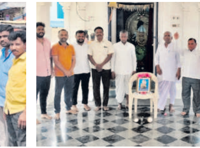
భిక్కనూరు మండలం కాచాపూర్లో పాపన్న చిత్రపటానికి నివాళులర్పిస్తున్న గౌడ సంఘం సభ్యులు