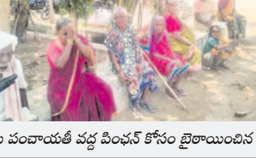
గ్రామ పంచాయతీ వద్ద పింఛన్ కోసం బైటాయింపిన వృద్ధులు

నిజాంనగర్, ఏప్రిల్ 2 : మహానగర్ మండలంలోని కొమలంపల్లి గ్రామ పంచాయతీ వద్ద పింఛన్ కోసం పలువురు వృద్ధులు మంగళవారం బైటాయింపారు. వృద్ధుల్లో చాలా మందికి వేలి ముద్దుల ప్రకారం పాపడం వంటివి కార్యదర్శి వెంటిమండల ద్వారా పంపిణీ చేయాలని కోరారు. అందుకు సంబంధించిన కార్యదర్శి రాజు కోసం మంగళవారం ఉదయం ఇలా వారు నిరీక్షించారు.