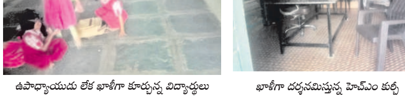
ఉపాధ్యాయుడు లేక ఖాళీగా కూర్చున్న విద్యార్థులు