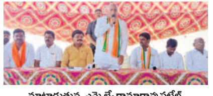
మాట్లాడుతున్న ఎమ్మెల్యే రామారావు పబ్లిక్

● ప్రజలను నమ్మించి మోసం చేసిన కాంగ్రెస్ ● బీజేపీ మండల నాయకుల సమావేశంలో ఎమ్మెల్యే రామారావు పబ్లిక్ కుబీర్, ఏప్రిల్ 2 : శాసనసభ ఎన్నికల్లో రాష్ట్ర ప్రజలకు ఇచ్చిన ఆరు గ్యారెంటీల వాగ్దానాల్లో ఏ ఒక్కటి అమలుకు నోచుకోక అటకెక్కినామని ముఖ్యమంత్రి ఎమ్మెల్యే రామారావు పబ్లిక్ కాంగ్రెస్ ప్రభుత్వంపై మండిపడ్డారు. మంగళవారం మండల కేంద్రం కుబీర్లో పాఠశాలను ఎన్నికల సేవకల్లో పాల్గొనాలి, కార్యక్రమం సన్నాహక సమావేశంలో పాల్గొని మాట్లాడారు. రూ.500ల వంటకాన్ని సిటిండర్ ఎక్కువ అమలు కాకపోగా, రూ.2 లక్షల రైతుల బ్యాంకు రుణాల జాబ్ లేదన్నారు. కాంగ్రెస్ వైఖర్యాలను అనుకూలంగా మలుచుకుని కార్యక్రమాలను సైనికుల్లా పనిచేసి ఆదిలాబాద్ పార్లమెంటు స్థానాన్ని భారీ మెజారిటీతో కైవసం చేసుకోవాలని కోరారు.