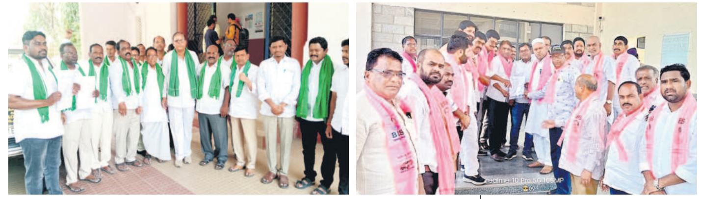
ఆదిలాబాద్ కలెక్టర్ కార్యాలయం ఎదుట నిరసన తెలుపుతున్న బీఆర్ఎస్ నాయకులు