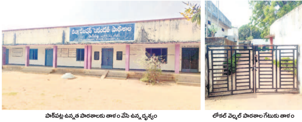
పాఠశాల ఉన్న పాఠశాలకు తాళం వేసి ఉన్న దృశ్యం