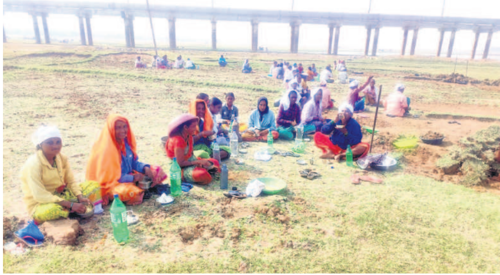
లోకల్ వెల్ఫేర్ సమీపంలోని ఎస్సార్స్ లో తట్టలు నెట్టిపై పెట్టుకుని భోజనం చేస్తున్న ఉపాధి కూలీలు

మహాత్మా గాంధీ జాతీయ గ్రామీణ ఉపాధి హామీ పథకం కుంటున్న ఎర్రటిండలో భోజనం చేస్తున్నారు. మంగళవారం మధ్యాహ్నం లోకల్ వెల్ఫేర్ గ్రామ సమీపంలోని ఎస్సార్స్ లో తట్టలు, టవల్స్ నెట్టిపై పెట్టుకుని సమాహంగా ఉంటున్నారు. సాధారణంగా ఉష్ణోగ్రతలు 40 డిగ్రీలు దాటుతుండడంతో సర్దారు కూలీలకు టిండ్లు, మంచినీరు, టీఆర్ఎస్ ప్యాకెట్లతోపాటు, మెడిసిన్ కిట్స్ ను అందుబాటులో ఉంచాలి. వసతులు కల్పించకపోవడంతో కూలీలు నడెండలోనే భోజనం చేస్తున్నారు. పడవెళ్ళ బాలన పడే ప్రమాదం ఉందని, వసతులు కల్పించాలని కూలీలు కోరుతున్నారు.