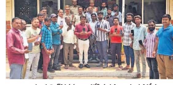
బాధితులకు సెల్ఫోన్లను అందజేసిన కుషాయిగూడ పోలీసులు

చోలీకి గురైన సెల్ ఫోన్లు బాధితులకు అందజేత