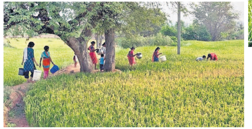
-మామారెడ్డి, ఏప్రిల్ 4

బిందెడు నీటి కోసం గిరిజనులు అప్పకష్టాలు పడుతున్నారు. తాగునీటి కోసం ఎక్కడో దూరాన ఉన్న పంట పొలాల బాటపడుతున్నారు. దాహాన్ని తీర్చండి సారూ అంటూ ఎన్నిసార్లు పిలువించినా పట్టించుకోనే నాభుడే కరువయ్యాడని చెబుతున్నారు ఈ గిరిజనం. తాగునీటి కోసం తల్లిబిడ్డలంతా పొలాలకు వెళ్లాల్సిన పరిస్థితి నెలకొన్నది. ఇది కామారెడ్డి జిల్లా మామారెడ్డి మండలం మైసమ్మ చెరువు తండా గ్రామ పరిధిలోని దుర్గమ్మగుడి తండాలో గిరిజనులు తాగునీటి తిప్పలు ఎదుర్కొంటున్నారని నడిచి నిరీక్షించారు. తండాలో దాదాపు 30 గిరిజన కుటుంబాలు నివసిస్తున్నాయి. ఇప్పటికైనా అధికారులు స్పందించి తాగునీటి సమస్యను పరిష్కరించాలని కోరుతున్నారు.