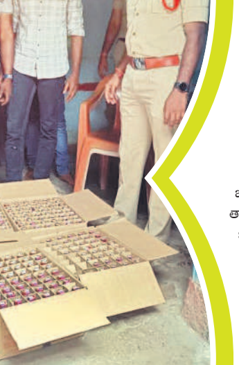
గండ్లవేటిలో పోలీసులు పట్టుకున్న మద్యం సీసాలు (ఫైల్)