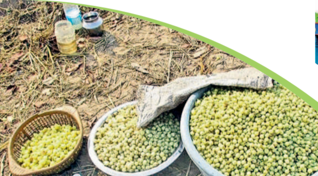
గిరిజనులు సేకరించిన ఇప్పప్పులు

కాంగ్రెస్ ప్రభుత్వ పరిపాలన తీరుతో అన్నదాతలు అరిగోస పడుతున్నారు. రాష్ట్రం ఏర్పడినప్పటి నుంచి సాగునీటి దీమాతో పంటలు సాగు చేసిన రైతులకు ఇప్పుడు పంట చేతికి వస్తుందా అనే ఆందోళన పెరుగుతున్నది. సాగునీటి నిర్వహణలో సర్కారు నిర్లక్ష్యం ఈ ఏడాది రైతులకు భారంగా నష్టం కలిగిస్తున్నది. ఎనిమిదేండ్లగా వచ్చినట్లుగా సాగునీరు రాకపోవడంతో పంటలను బతికించుకునేందుకు అన్నదాతలు అప్రయోజన పడుతున్నారు. సాగు చేసిన పంటను కాపాడుకునేందుకు లక్షలు ఖర్చు వెళ్ళి అప్పుల పాలవుతున్నారు. యాసంగిలో సాగు చేసిన పంటలకు మరో నెల వరకు సాగునీరు అవసరం ఉంటుంది. రాష్ట్ర ప్రభుత్వ నిర్లక్ష్యం వల్ల కాల్యాల నుంచి వెరుపులు, పంట లకు నీరు రావడం లేదు. దీంతో పంటలను కాపాడుకునేందుకు రైతులు కొత్తగా బావులను తవ్వించారు. ఎక్కువ మంది రైతులు ఉన్న బావుల్లో పూడిక తీయిస్తున్నారు. బావుల తవ్వకం, పూడికతీత రైతులపై ఆర్థికంగా భారం పడుతున్నది. కొత్త బావి తవ్వించుకుంటే రూ.6 లక్షల నుంచి రూ.12 లక్షల ఖర్చవుతున్నది. పూడికతీత కోసం గరిష్ఠంగా రూ.4 లక్షల వరకు ఖర్చు చేస్తున్నారు. సాగునీటి సమస్యతో సాంతంగా నీటి వసరులను కల్పించుకునేందుకు రైతులు భారీగా ఖర్చు చేయాలి రావడంతో వారికి అప్పులు పెరుగుతున్నాయి. సర్కారు సాగునీరు ఇవ్వకపోవడంతో ఈసారి యాసంగి పంట చేతికి వచ్చే దాకా నమ్మకం లేదు. ఇలాంటి పరిస్థితిలో నీటి వసరుల కోసం అప్పులు చేయాలి రావడంతో రైతుల్లో ఆందోళన ఎక్కువ అవుతున్నది.