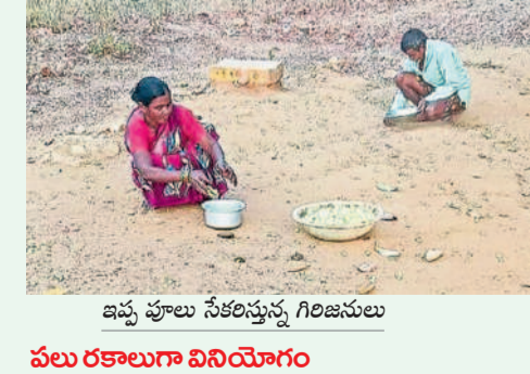
ఇప్పి పూల సేకరిస్తున్న గిరిజనులు

ఇప్పిపూల సేకరణ గిరిజనులకు వేసవితో చక్కని ఉపాధి జీసీసి ద్వారా కానుకగా గిట్టుబాటు ధర లేక తక్కువైన ఆసక్తి