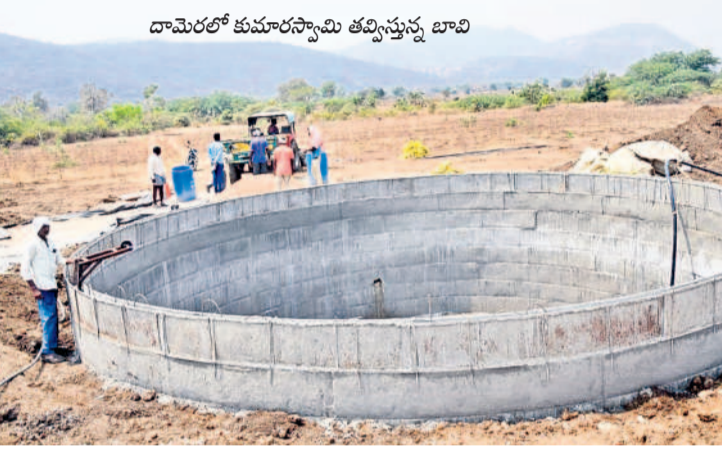
దామెరలో కుమారస్వామి తవ్వించిన బావి

కాంగ్రెస్ ప్రభుత్వ పరిపాలన తీరుతో అన్నదాతలు అరిగోస పడుతున్నారు. రాష్ట్రం ఏర్పడినప్పటి నుంచి సాగునీటి దీమాతో పంటలు సాగు చేసిన రైతులకు ఇప్పుడు పంట చేతికి వస్తుందా అనే ఆందోళన పెరుగుతున్నది. సాగునీటి నిర్వహణలో సర్కారు నిర్లక్ష్యం ఈ ఏడాది రైతులకు భారంగా నష్టం కలిగిస్తున్నది. ఎనిమిదేండ్లగా వచ్చినట్లుగా సాగునీరు రాకపోవడంతో పంటలను బతికించుకునేందుకు అన్నదాతలు అప్రయోజన పడుతున్నారు. సాగు చేసిన పంటను కాపాడుకునేందుకు లక్షలు ఖర్చు వెళ్ళి అప్పుల పాలవుతున్నారు. యాసంగిలో సాగు చేసిన పంటలకు మరో నెల వరకు సాగునీరు అవసరం ఉంటుంది. రాష్ట్ర ప్రభుత్వ నిర్లక్ష్యం వల్ల కాల్యాల నుంచి వెరుపులు, పంట లకు నీరు రావడం లేదు. దీంతో పంటలను కాపాడుకునేందుకు రైతులు కొత్తగా బావులను తవ్వించారు. ఎక్కువ మంది రైతులు ఉన్న బావుల్లో పూడిక తీయిస్తున్నారు. బావుల తవ్వకం, పూడికతీత రైతులపై ఆర్థికంగా భారం పడుతున్నది. కొత్త బావి తవ్వించుకుంటే రూ.6 లక్షల నుంచి రూ.12 లక్షల ఖర్చవుతున్నది. పూడికతీత కోసం గరిష్ఠంగా రూ.4 లక్షల వరకు ఖర్చు చేస్తున్నారు. సాగునీటి సమస్యతో సాంతంగా నీటి వసరులను కల్పించుకునేందుకు రైతులు భారీగా ఖర్చు చేయాలి రావడంతో వారికి అప్పులు పెరుగుతున్నాయి. సర్కారు సాగునీరు ఇవ్వకపోవడంతో ఈసారి యాసంగి పంట చేతికి వచ్చే దాకా నమ్మకం లేదు. ఇలాంటి పరిస్థితిలో నీటి వసరుల కోసం అప్పులు చేయాలి రావడంతో రైతుల్లో ఆందోళన ఎక్కువ అవుతున్నది.