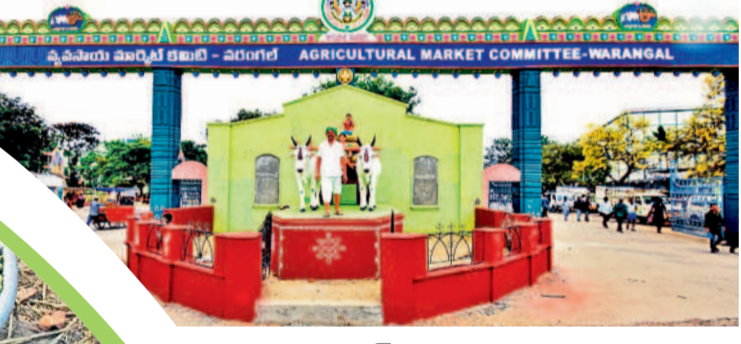
మార్కెట్ కు వరుస సెలవులు