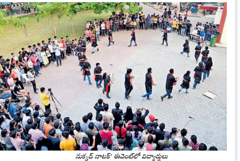
సుకృద్ నాటక్ ఈవెంట్లో విద్యార్థులు