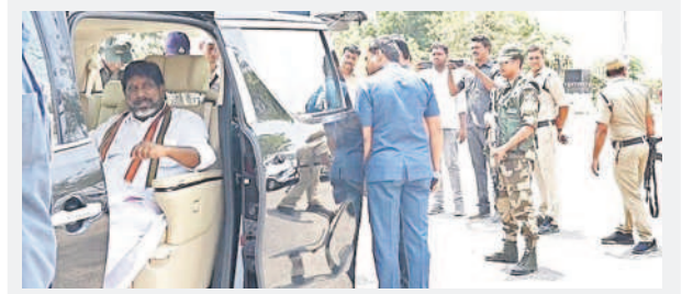
డిప్యూటీ సీఎం భట్టి విక్రమార్క కారును ఎన్నికల అధికారులు శుక్రవారం మధిర చెక్పోస్ట్ వద్ద తనిఖీ చేశారు. ఎన్నికల నియమావళికి అనుగుణంగా అన్ని వాహనాల మాదిరిగానే భట్టి కారును కూడా తనిఖీ చేశారు. -మధిర, ఏప్రిల్ 5