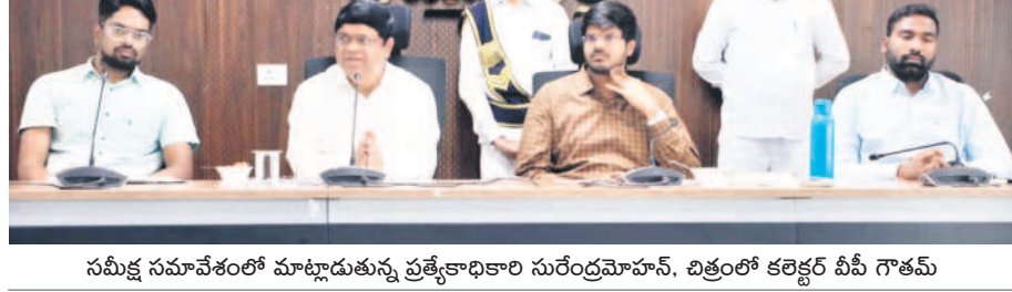
సమీక్ష సమావేశంలో మాట్లాడుతున్న ప్రత్యేకాధికారి సురేంద్రమోహన్, చిత్రంలో కలెక్టర్ వీపీ గౌతమ్

మామిళ్ళగూడెం, ఏప్రిల్ 5 : తాగునీటి సమస్యలు తీవ్రతరంగా ముందస్తు చర్యలు చేపట్టాలని ఉభయ ఖమ్మం జిల్లాల తాగునీటి సరఫరా పర్యవేక్షణ ప్రత్యేక అధికారి, ప్రభుత్వ కార్యదర్శి సురేంద్రమోహన్ అధికారులను ఆదేశించారు. శుక్రవారం కలెక్టర్ వీపీ గౌతమ్ ముందు రంగంలో కలెక్టర్ వీపీ గౌతమ్తో కలిసి మిషన్ జగన్, ముస్లిం, ఇరిగేషన్, రెవెన్యూ, వనాయత్తి అధికారులతో జిల్లాలో తాగునీటి సరఫరాపై సమీక్షించారు. ఈ సందర్భంగా సురేంద్రమో