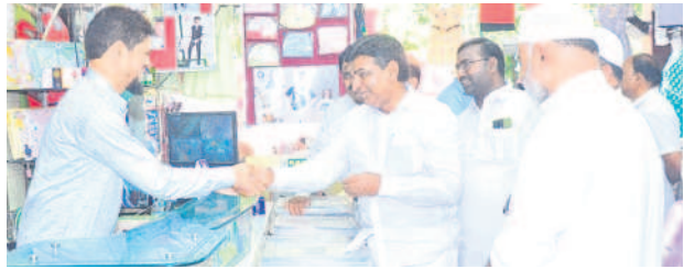
ఖమ్మం నగరంలో ప్రచారం చేస్తున్న ఖమ్మం ఎంపీ నామా నాగేశ్వరరావు