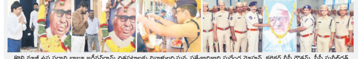
తొలి మాజీ ఉప ప్రధాని బాబూ జగ్జీవన్ రామ్ చిత్రపటాలకు నివాళులర్పిస్తున్న ప్రత్యేకాధికారి సురేంద్ర మోహన్, కలెక్టర్ వీపీ గౌతమ్, సీపీ సునీల్ దత్

రన్నారు. నేరుగా షీ టీఎం బృందాలను కలిసి ఫిర్యాదు చేయాల్సిన పనిలేదని, డయిటి100, వాట్సాప్, క్యూఆర్ కోడ్ తదితర అనేక విధానాల్లో సూ ఫిర్యాదు చేయవచ్చన్నారు.