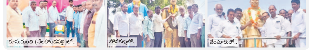
కూసుమంచి (నేలకొండపల్లి)లో.. బోనకల్లులో.. వేంసూరులో..

మొన్నటి రోజున పూర్తిగా ఎండిపోయి కనిపించిన పాలేరు జలాశయం.. సాగర్ జలాశయం కళకళలాడింది. గురువారం తెల్లవారుజామున పాలేరుకు సాగర్ జలాశయం మొదలైంది. సాగర్ ఎడమ కాలువకు 6,100 క్యూసెక్కుల నీటిని వదులుతున్నారు. పాలేరుకు 5,200 క్యూసెక్కుల నీరు రావడం రికార్డుగా నిలిచింది. సాగర్ నుంచి 135 కిలోమీటర్ల దూరంలో ఎక్కడా నీటి మళ్లింపు/చౌర్యం లేకుండా నేరుగా మునగాల రిజర్వాయర్ నుంచి పాలేరుకు నీరు వస్తున్నది. గురువారం సాయంత్రానికి 3,100 క్యూసెక్కులు, శుక్రవారం సాయంత్రానికి 5,200 క్యూసెక్కుల నీరు వచ్చింది. దీంతో నీటి మట్టం 13 అడుగులకు చేరుకుంది. మరో రెండు రోజుల్లో 18 అడుగుల వైద నీటి మట్టం పెరిగే అవకాశముంది. పాలేరు రిజర్వాయర్ పూర్తి స్థాయి నీటి మట్టం 23 అడుగులు. -కూసుమంచి, ఏప్రిల్ 5