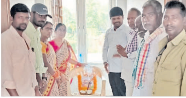
బీబీపేట్ మండలం జనగామలో