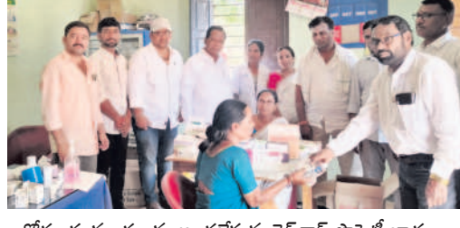
రోగిలకు మందులను అందజేస్తున్న రెడ్ క్రాస్ సొసైటీ బాధ్యులు