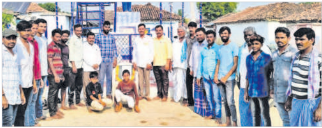
బాన్సువాడ మండలం బోర్డంలో..