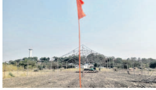
డోంగ్గిలో ఏర్పాటుచేస్తున్న మండపం