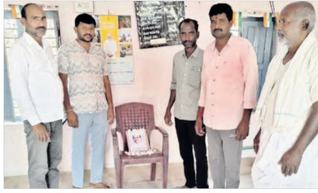
పిట్లం మండలం కర్తి గ్రామంలో..