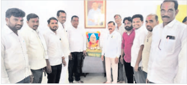
జుక్కల్ ఎమ్మెల్యే క్యాంపు కార్యాలయంలో..