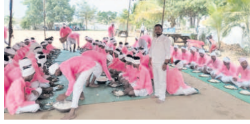
బిట్లంలో పాల్గొన్న సేవాలాల్ మాలధారులు