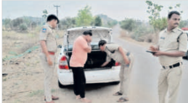
కారు తనిఖీ చేస్తున్న పోలీసులు

రాజంపేట్, ఏప్రిల్ 5: ఎన్ఫోర్స్ కోడ్ నేపథ్యంలో మండలంలోని బస్సులపై శివారులో పోలీసులు శుక్రవారం వాహనాల తనిఖీ నిర్వహించారు. ఈ సందర్భంగా ఎన్నో సంవత్సరాల వాహనాలను సరైన ఆధారాలు లేకుండా రూ. 50 వేలకు మించి తరలించడం నుంచి నివారించారు.