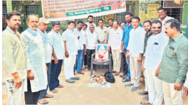
నర్రుపల్లిలో నివాళులర్పిస్తున్న డీఆర్ఎస్ నాయకులు