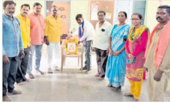
బిమ్మండల్ నివాళులర్పిస్తున్న ఎమ్మార్పీఎస్(టీఎస్) నాయకులు