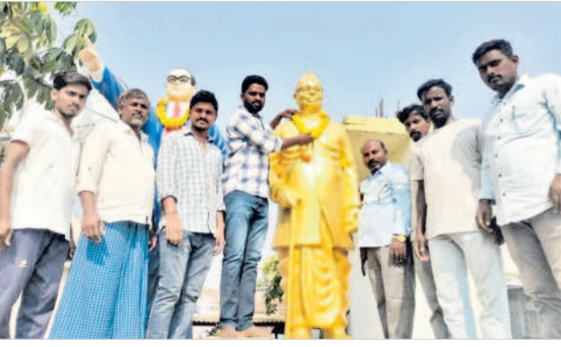
నిజాంసాగర్ మండలం మాగి గ్రామంలో..