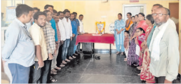
కామారెడ్డి మున్సిపల్ కార్యాలయంలో..