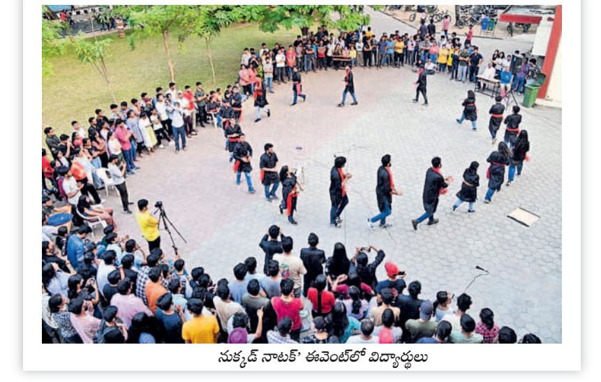
సుక్కర్ నాట్ ఈవెంట్లో విద్యార్థులు