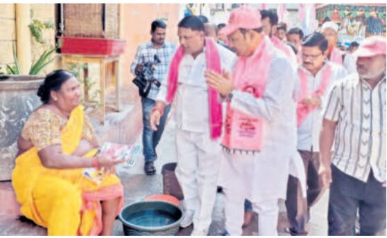
ఇందూరులోని 44వ డివిజన్లో ప్రచారం చేస్తున్న బిగాల

రాజీవ్ గాంధీ హాస్టంకు, కలెక్టర్, జిల్లా ఎన్నికల అధికారి