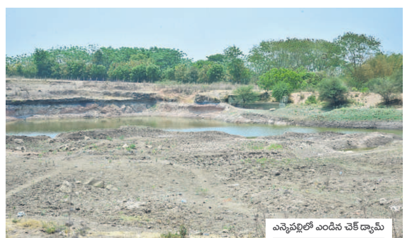
ఎన్నెవల్లో ఎండిన చెక్ డ్యామ్