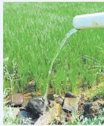
పుడూరు మండలంలోని మేడిపల్లి గ్రామ పద్ద ఉన్న బోరు ఒకప్పుడు పుల్లగా నీళ్లు పోయగా, ప్రస్తుత పరిస్థితి ఇది..