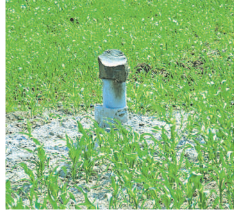
భూగర్భ జలాలు తగ్గడంతో వదావుపల్ల బోరు

కరెంటు కోతలు, సాగునీటి కొరత వంటి ఎనిమిది ప్రధాన నమస్కలతో ఇబ్బందులు కాంగ్రెస్ పాలనలో అప్పలపాలవుతున్న రైతులు కరువుతో అగమ్యగోచరంగా మారుతున్న బతుకులు మునుపటి కష్టాలు వచ్చాయని ఆవేదన చెందుతున్న అన్నదాతలు