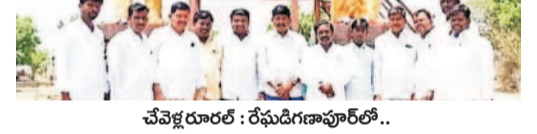
షాద్ నగర్ లో జగ్జీవన్ రామ్ విగ్రహానికి నివాళులర్పిస్తున్న నాయకులు