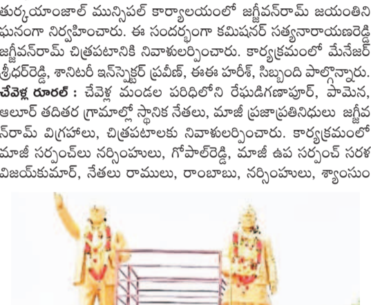
చేపేట రూరల్ : రేపటికాంబేద్కర్..