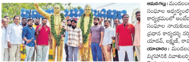
తుర్యయాంజాల్ : ఇంజనీర్ల చౌరస్థాల్..