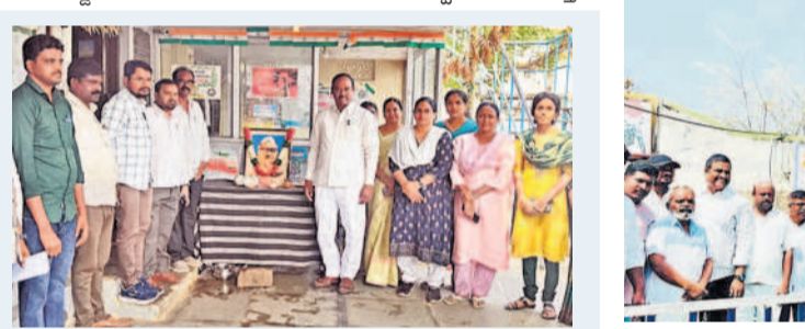
పెద్దలంబరపేట : మున్సిపల్ కార్యాలయంలో నివాళులర్పిస్తున్న కమిషనర్ రవీందర్ రెడ్డి, మున్సిపల్ అధికారులు నిబ్బంది