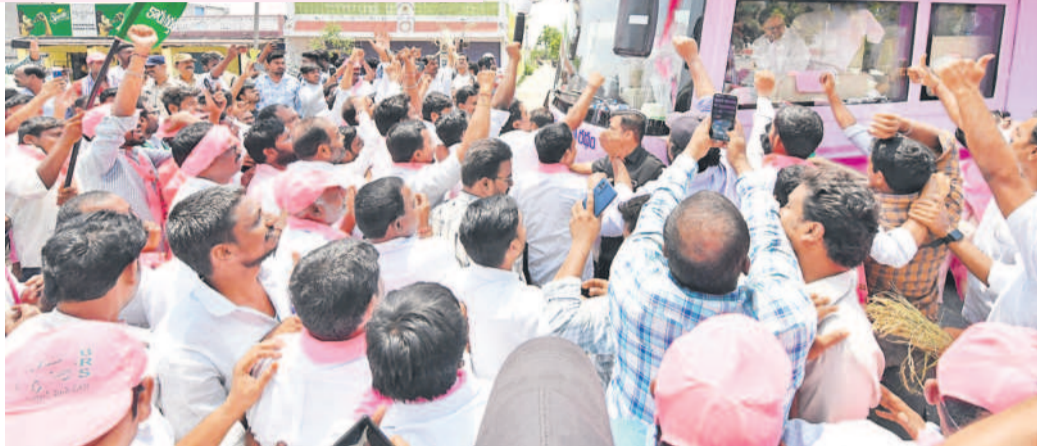
సిద్దిపేట జిల్లా బెజ్జంకి క్రాసింగ్ వద్ద బీఆర్ఎస్ శ్రేణులకు, రైతులకు బస్సులో నుంచి అభివాదం చేస్తున్న బీఆర్ఎస్ అధినేత కేసీఆర్