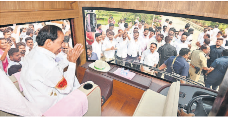
సిద్దిపేట జిల్లా ఎర్రవల్లిలో కార్యకర్తలకు అభివాదం చేస్తున్న బీఆర్ఎస్ అధినేత కేసీఆర్