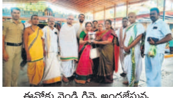
ఈవోకు వెండి గిన్నె అందజేస్తున్న దాత, కుటుంబ సభ్యులు