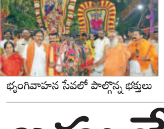
భృగివాహన సేవలో పాల్గొన్న భక్తులు

వెల్లెండ్, ఏప్రిల్ 6: మండలంలోని గుండల తయారీ స్థావరాలపై ఎమ్మెల్యే అధికారులు, పోలీసులు సంయుక్తంగా శనివారం దాడులు నిర్వహించారు. మైసమ్మపల్లె గుండల తయారీ స్థావరాలపై దాడులు నిర్వహించారు. 1200 లీటర్ల బెల్లం పాకం పారబో