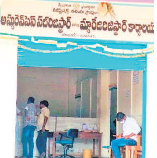
ములుగులోని సబ్ రిజిస్ట్రార్ కార్యాలయం

ములుగులోని సబ్ రిజిస్ట్రార్ కార్యాలయం సైతం కార్యాలయం ముద్ర వేస్తే రూ. 500 నుంచి రూ. 1000 వరకు సూచించేస్తున్నారు. డాక్యుమెంట్ సంబంధం రిజిస్ట్రార్ నమోదు చేయాలిని అటెండర్లు వెన్యూలో సంబంధ డాక్యుమెంట్ రైటర్ పేరు, ఎన్ని డాక్యుమెంట్ల సమోదయామో రాసుకుంటున్నారు. కార్యాలయం వేళలు ముగిసిన తర్వాత అధికారులు, సిబ్బంది వాటాలు తీసుకొని వెళ్తున్నారు. ఉన్నతాధికారులు స్పందించి సబ్ రిజిస్ట్రార్ కార్యాలయం వద్ద డాక్యుమెంట్ రైటర్ల దండం అడ్డుకుట్టే వేయకుంటే ప్రజలు తీవ్ర ఇబ్బందులు పడే పరిస్థితి ఉంటుంది. ప్రజలే భూమి, మ్యూరల్ రిజిస్ట్రేషన్ కోసం నేరుగా కార్యాలయానికి వచ్చేలా చర్యలు తీసుకోవాల్సి అవసరం అంటేనా ఉంది.